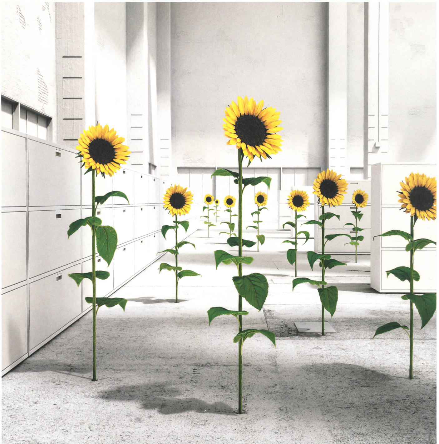
Stauraumsystem LO QUB

Lista Office LO in Ihrer Nähe > www.lista-office.com/vertrieb