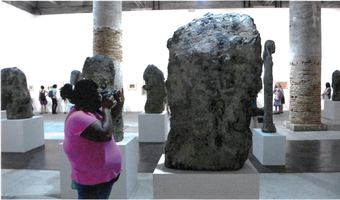
Hans Josephson, Untitled (1988–2006).