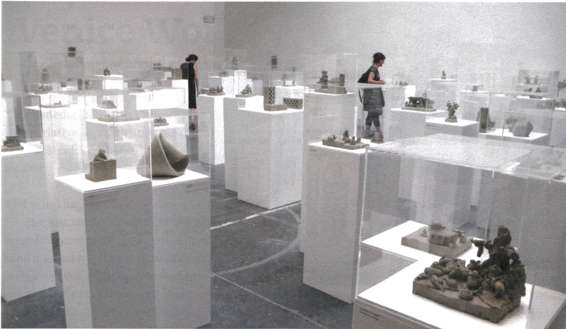
Peter Fischli und David Weiss, Plötzlich diese Übersicht (1981).