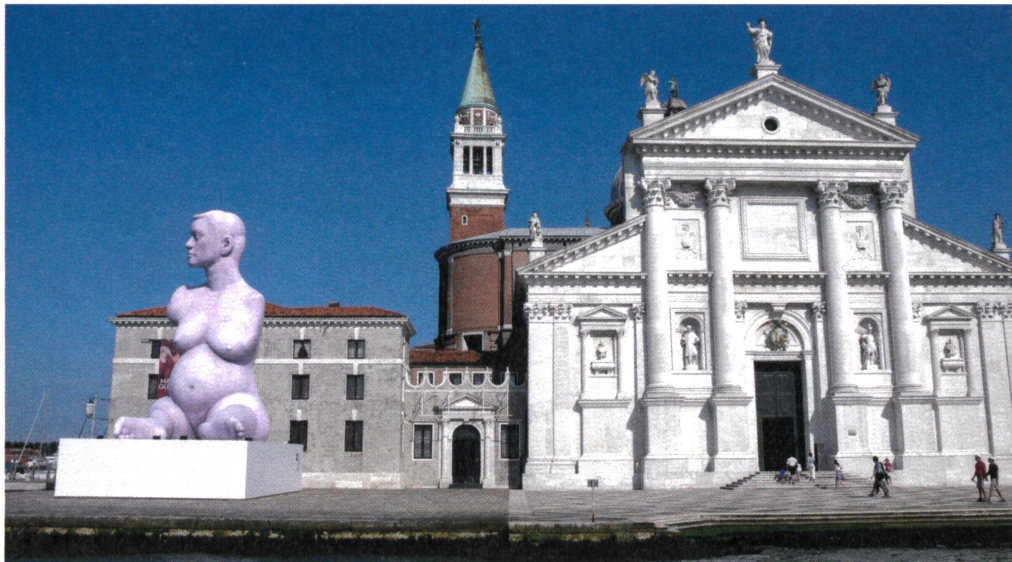
Marc Quinn: Breath (2012), Fondazione Giorgio Cini.