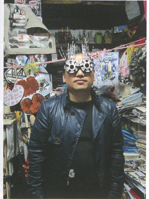
Links und oben: Lu Yang: Wrathful King Kong Core, 2011.