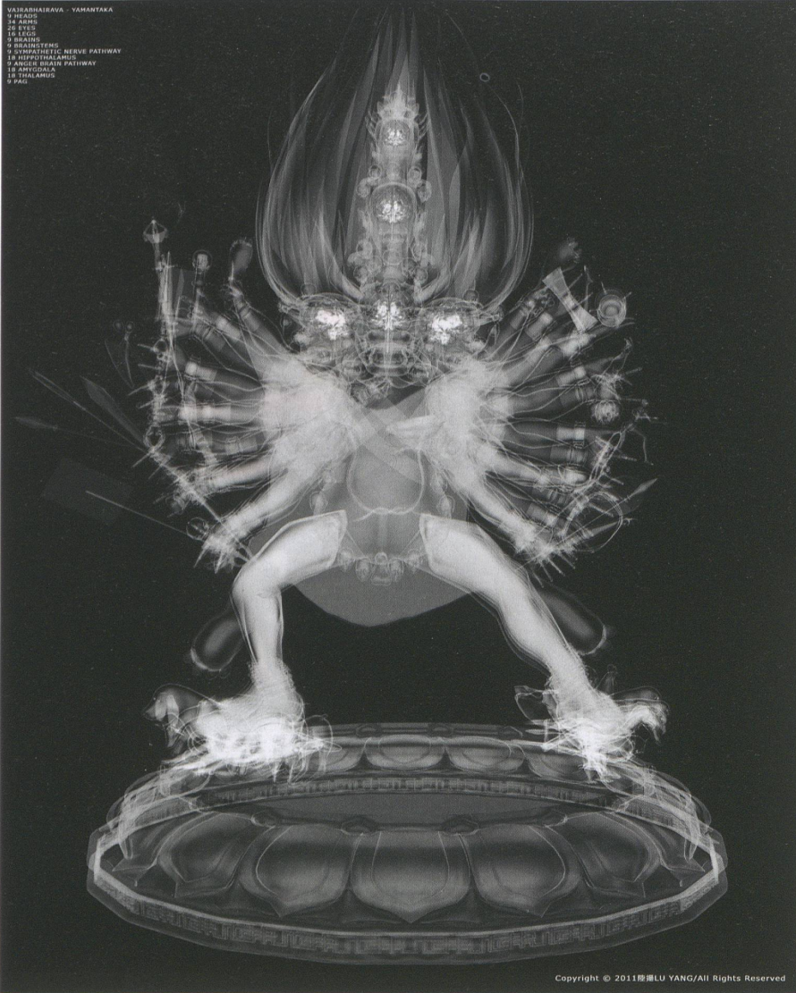
Copyright © 2011 陸揚 LU YANG/All Rights Reserved