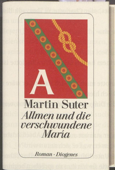
224 Seiten, Leinen, sFr 26.90* Auch als E-Book und Hörbuch