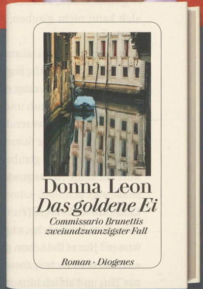
320 Seiten, Leinen, sFr 32.90* Auch als E-Book und Hörbuch

Der 6. Band von Martin Walkers erfolgreicher Krimireihe – auf Deutsch über 1 Mio. verkaufte Exemplare. Bruno, Chef de police, muss eine Serie von Raubüberfällen aufklären. Deren Spuren führen zurück in den Sommer 1944, als die Résistance einen Geldtransport überfiel und mit der Beute das Weite suchte.