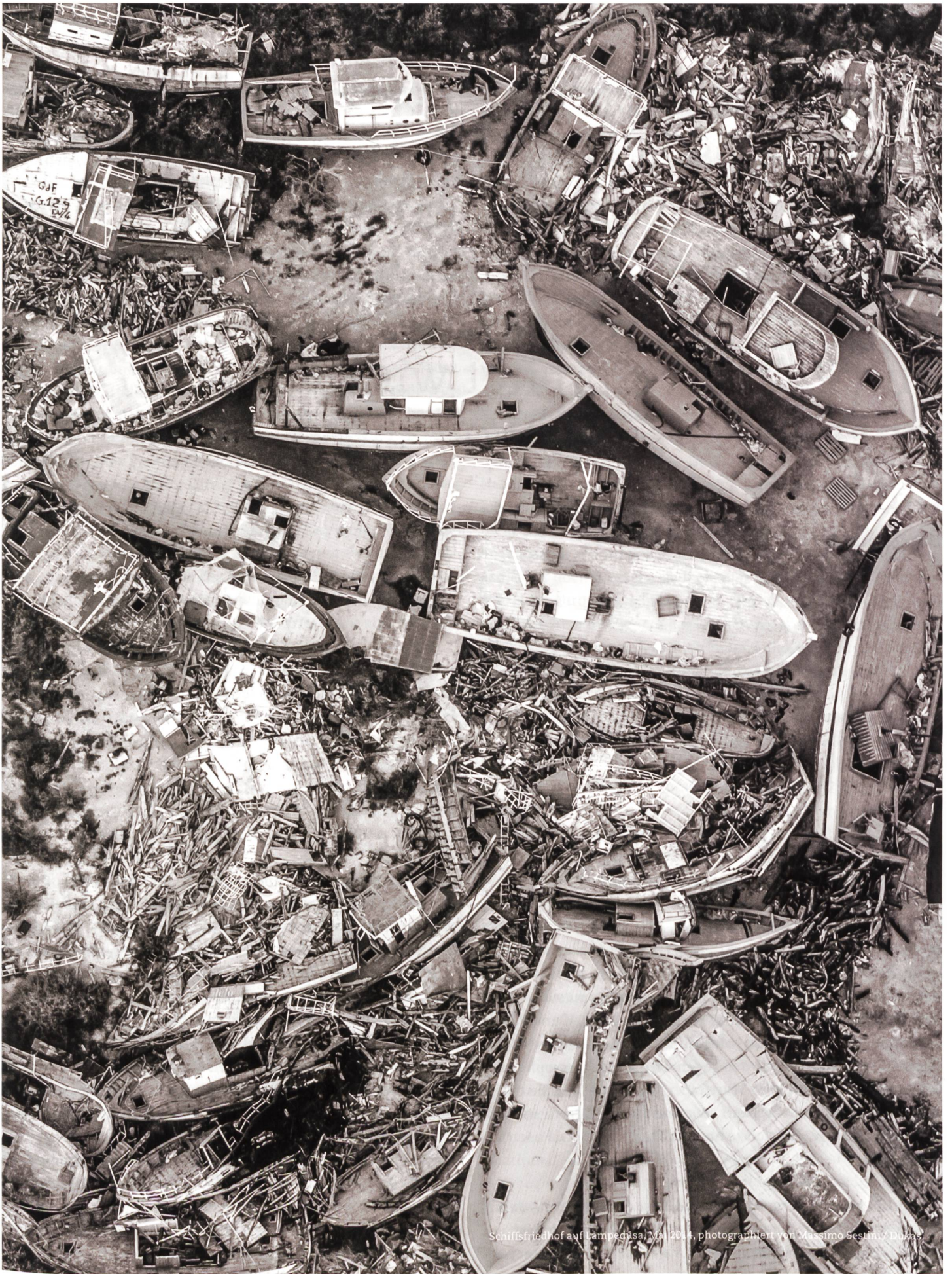
Schiffsfriedhof auf Lampedusa, MA 2014