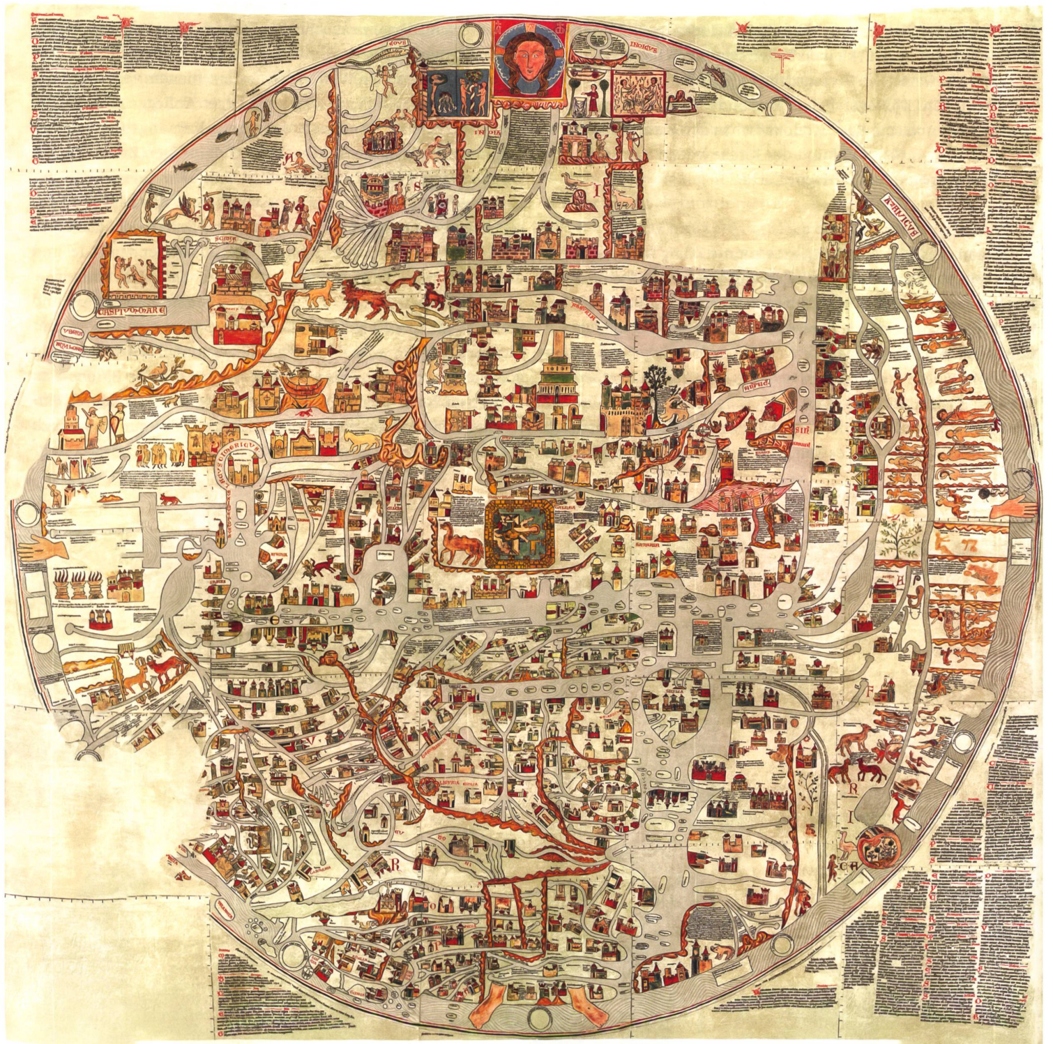
Die Welt des 13. Jahrhunderts war mit ihren unbekanntem Landen und Fabelwesen etwas anders gestaltet als die unsere. In England (unten links) erliess der glücklose King John 1215 aber ein Edikt, das den Grundstein für seine 800jährige Erfolgsgeschichte legte: die Magna Carta. Bild: Ebstorfer Weltkarte, circa 1300.