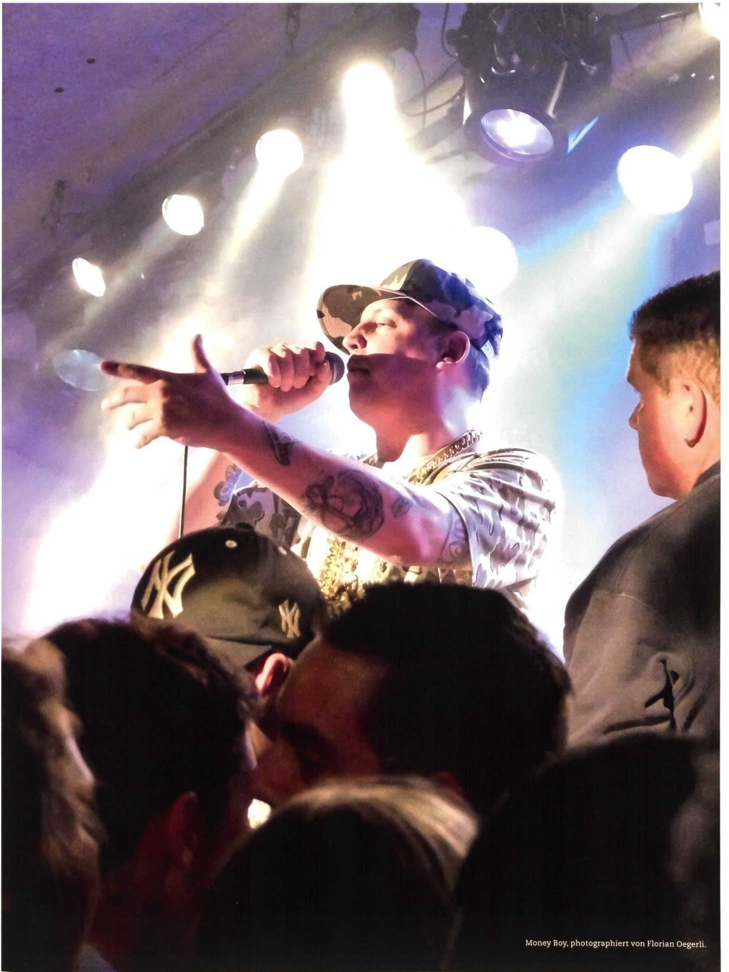
Money Boy