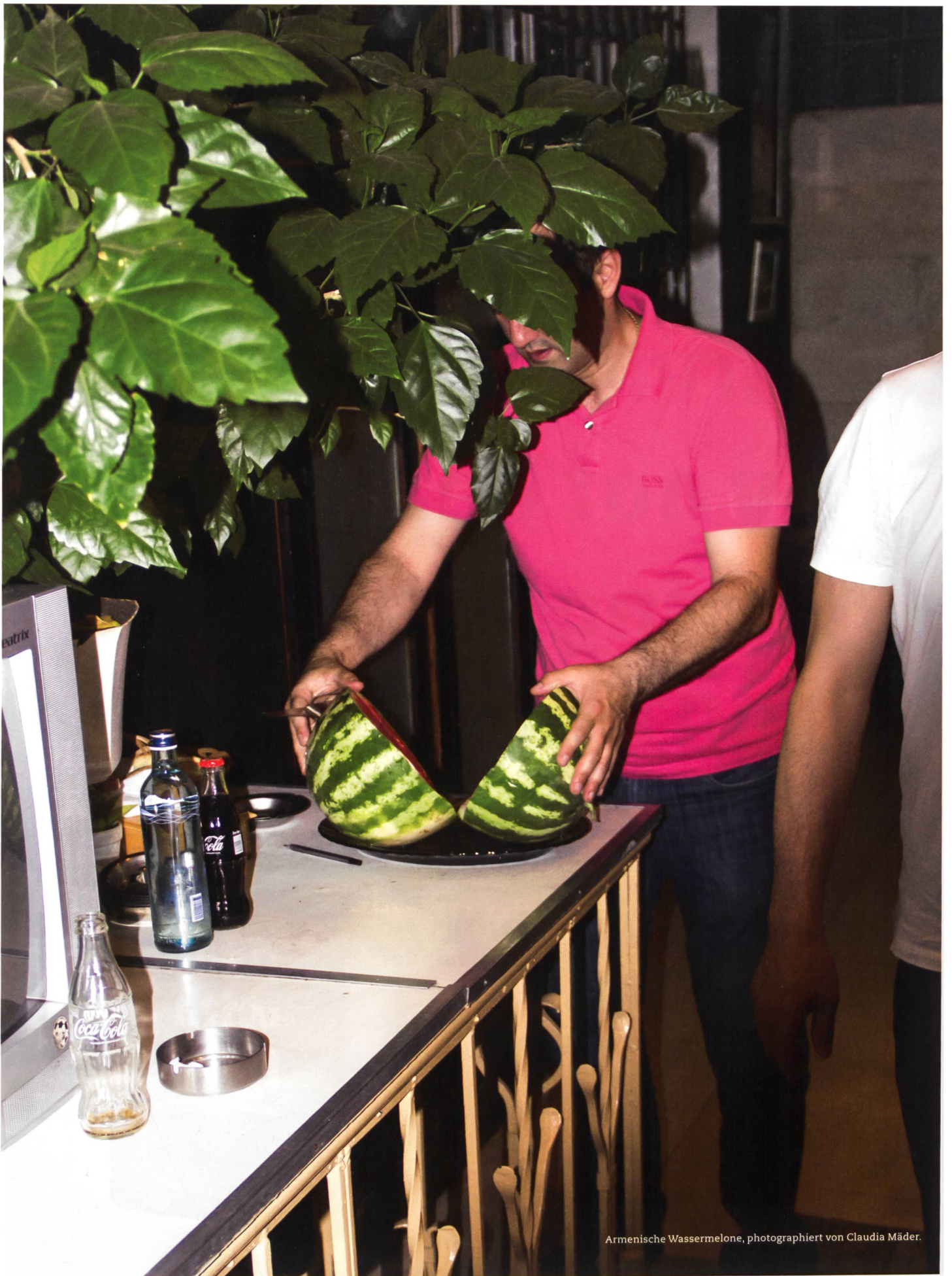
Armenische Wassermelone.