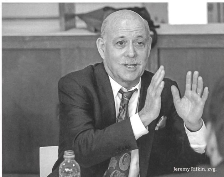
Jeremy Rifkin