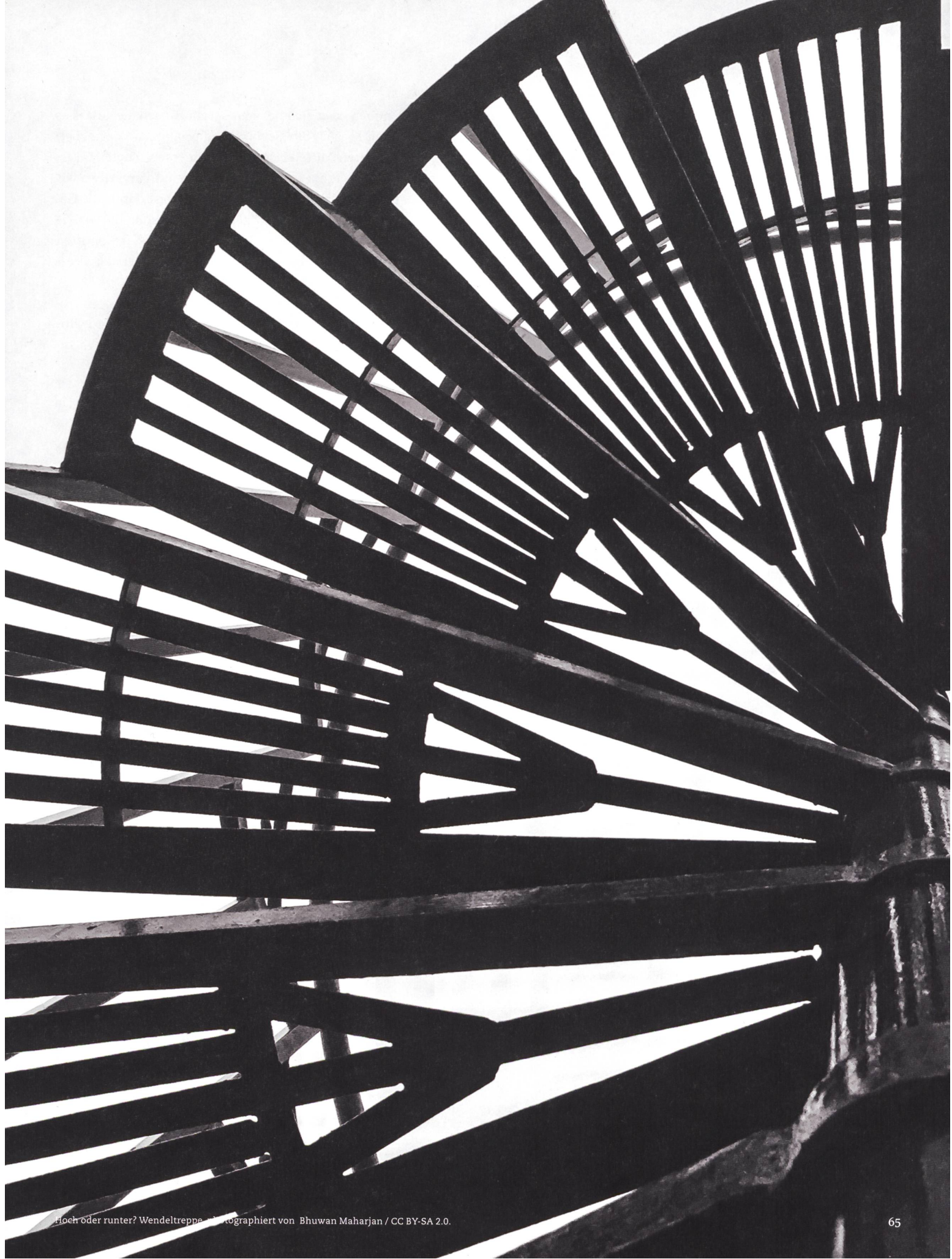
Hoch oder runter? Wendeltreppe fotografiert von Bhuwan Maharjan / CC BY-SA 2.0.