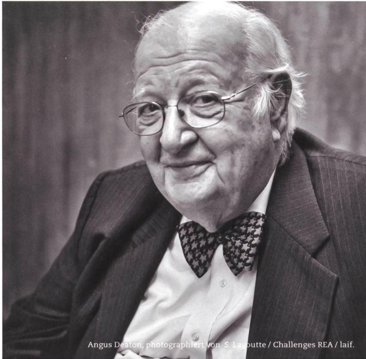
Angus Deaton