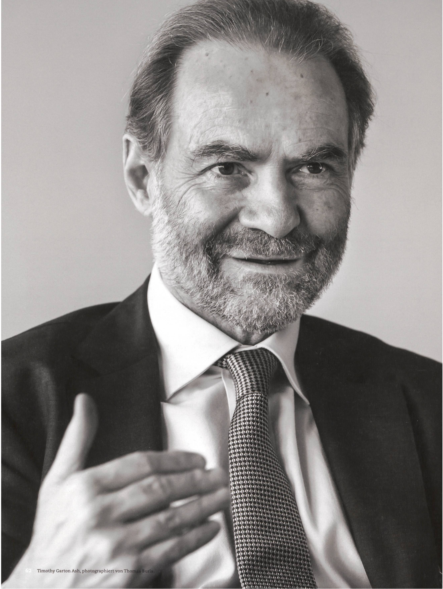
62 Timothy Garton Ash