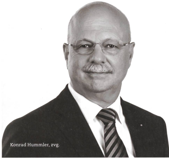
Konrad Hummler, zvg.