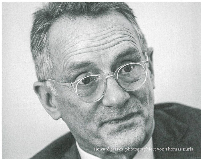
Howard Marks