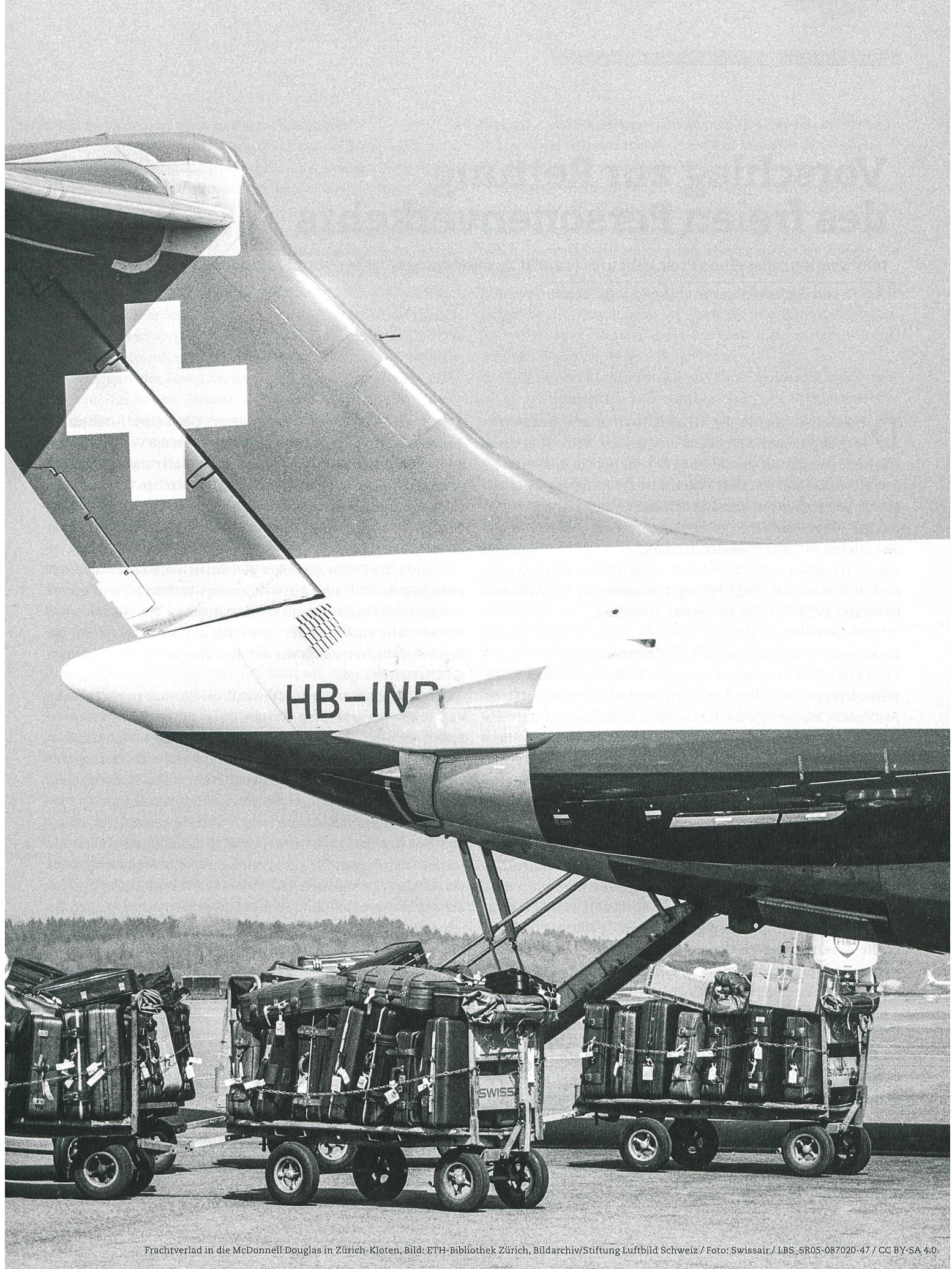
Frachtverlad in die McDonnell Douglas in Zürich-Kloten