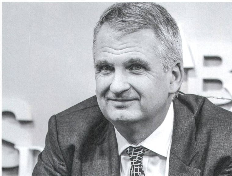
Timothy Snyder