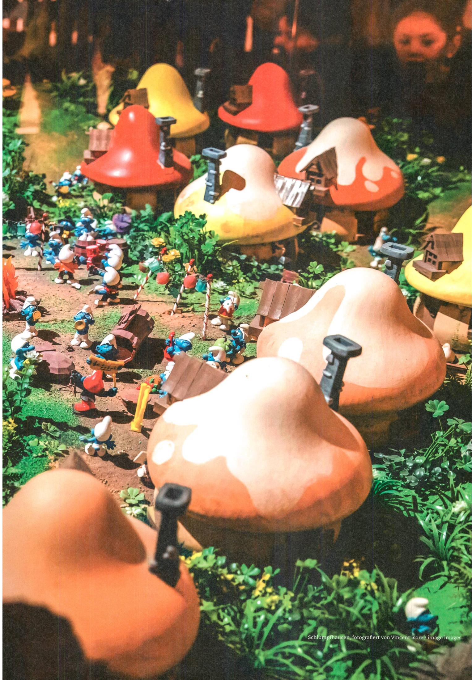
Schlumpfhausen, fotografiert von Vincent Isore / imago images.