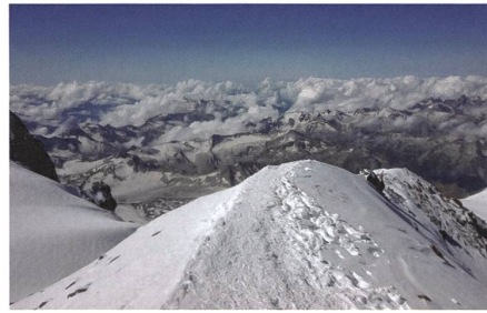
Auf dem Gipfel des Elbrus.