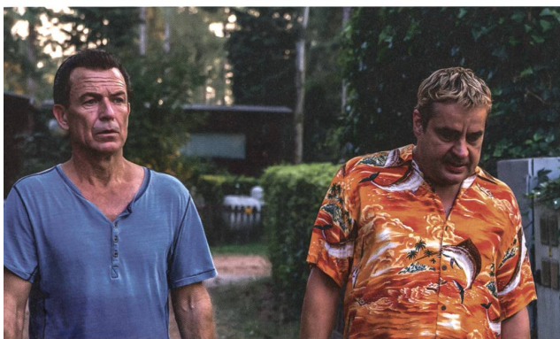
Bild: Screenshot Netflix mit Ferry Bouman rechts.