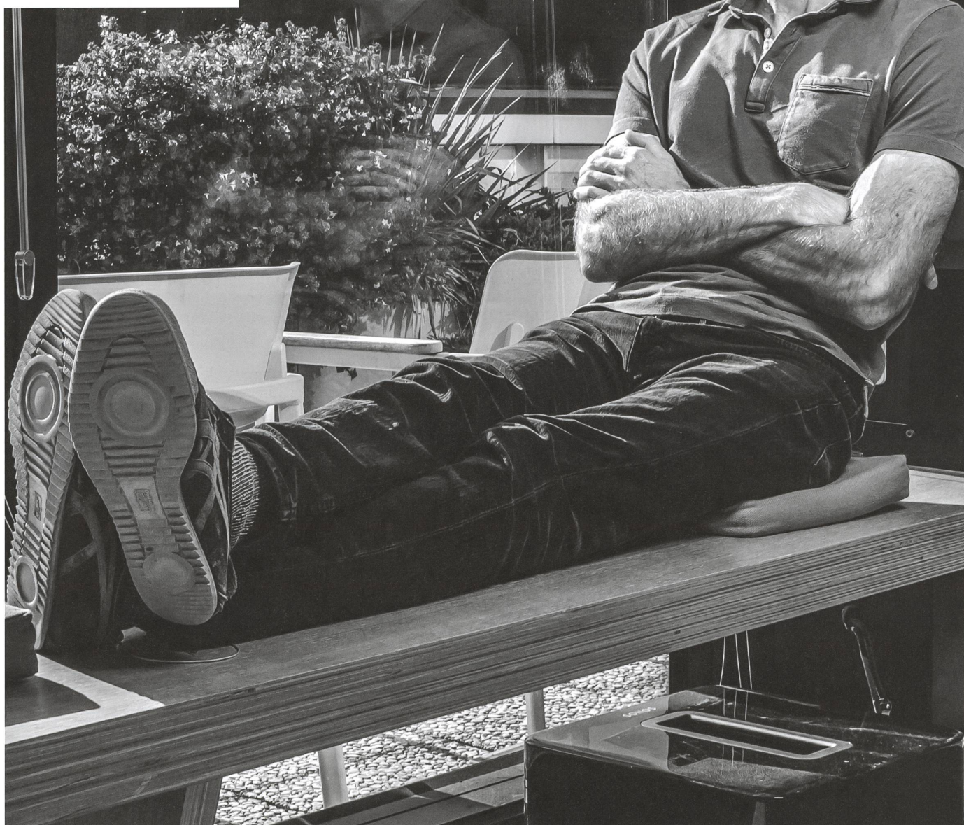
Michael Shellenberger.