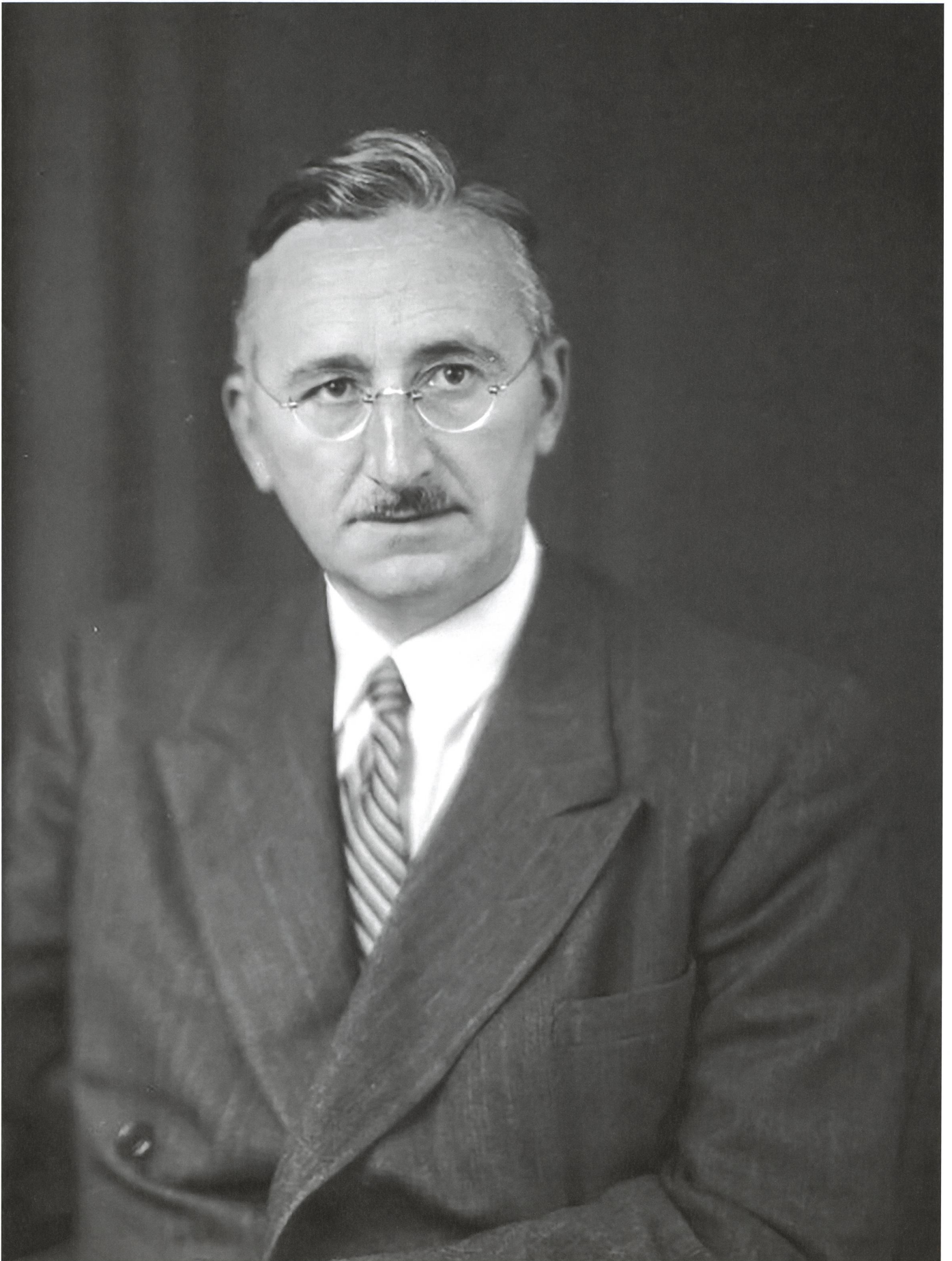
Friedrich August von Hayek im Juni 1945.