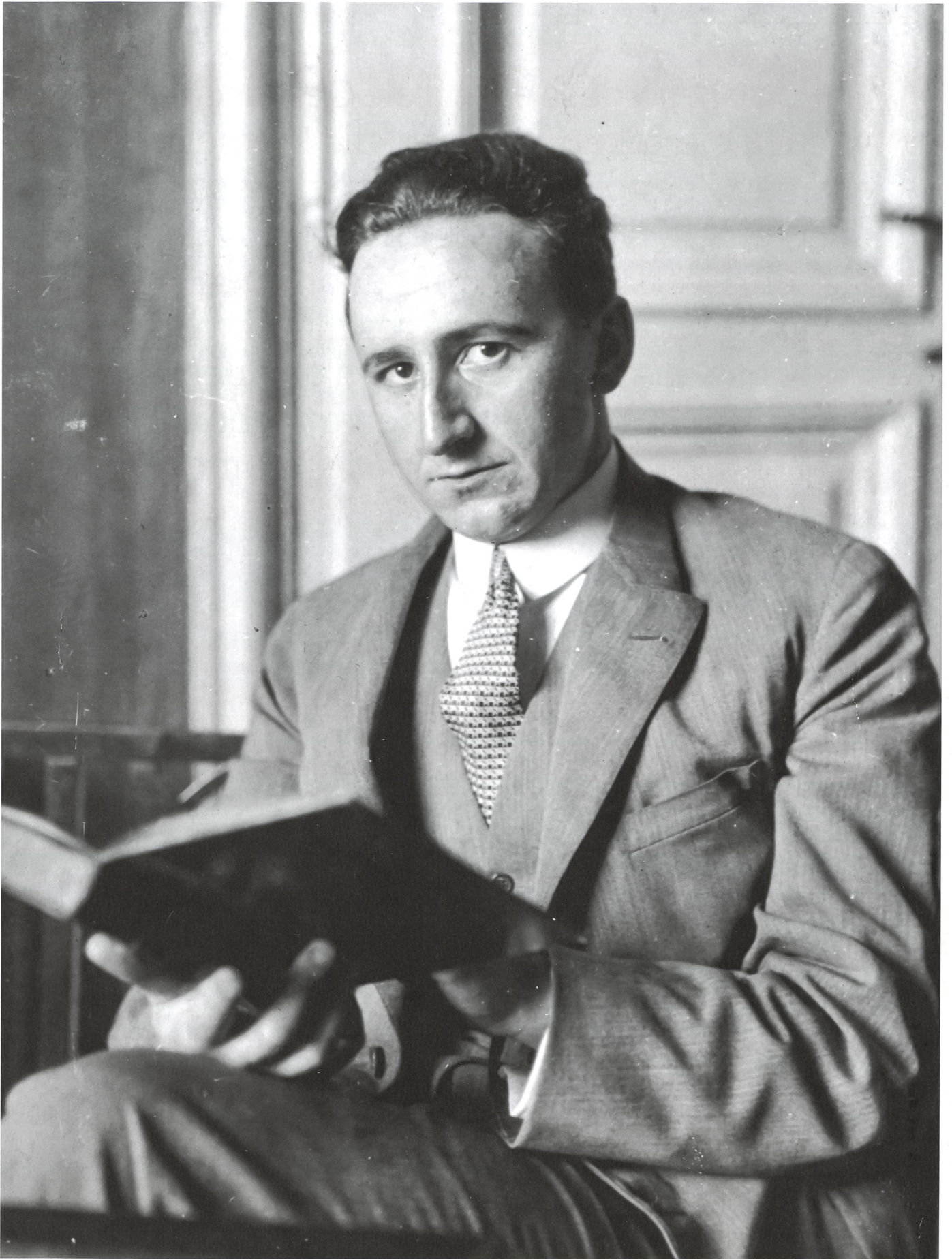
Friedrich August von Hayek in Jugendjahren.