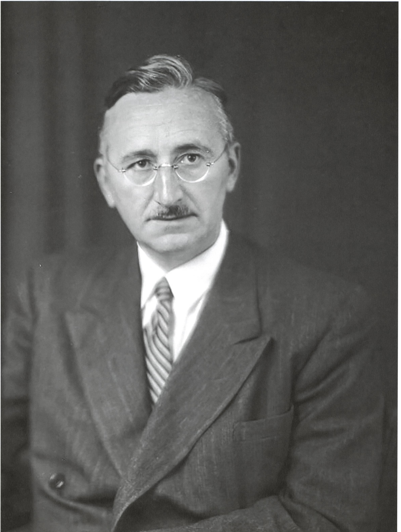
Friedrich August von Hayek im Juni 1945.