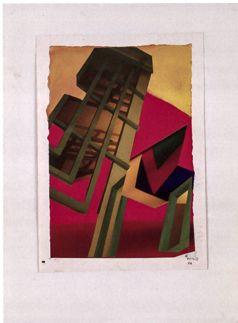
Elisabeth Wild, Ohne Titel, 2006, Collage auf Papier, 37 x 27,5 cm, Bild: Ed Mumford.