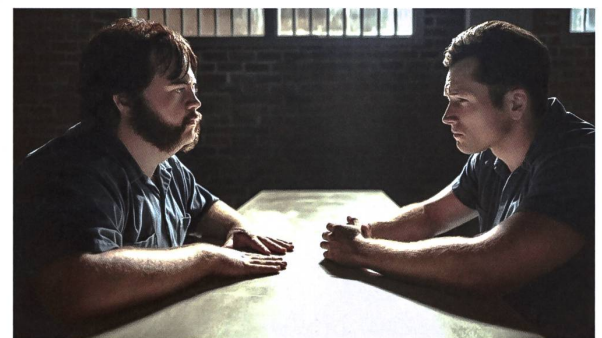
Auge in Auge: Der Serienmörder (gespielt von Paul Walter Hauser, links) und der Under-Cover-Mitgefangene (dargestellt von Taron Egerton).