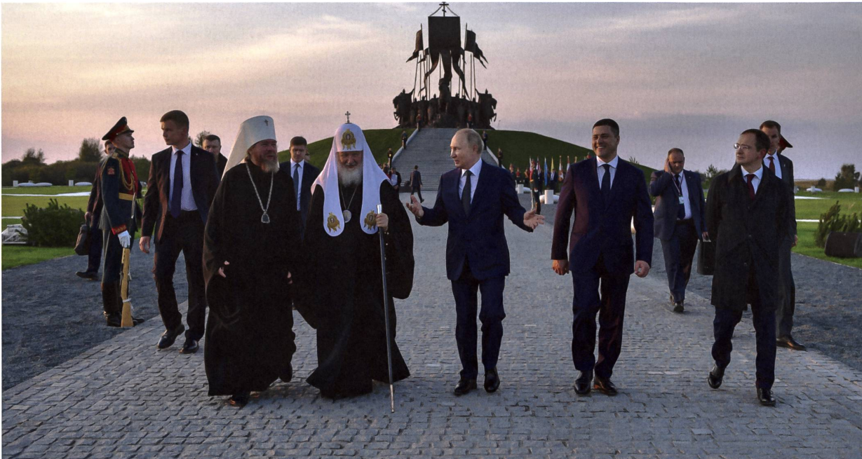
Die Klammer im russischen Reich war lange Zeit der orthodoxe Glauben: Wladimir Putin (Mitte) und Patriarch Kirill von Moskau (2. v.l.) im September 2021 an der Eröffnung der Gedenkstätte für Fürst Alexander Newski am Ufer des Peipussee, der zwischen Russland und Estland liegt.

zu tun, der sich vom römisch-katholischen Glauben unterscheidet: Für die Orthodoxie geht es bei Freiheit um die Opferbereitschaft als Weg der Reinigung. Deswegen ist Ostern, die Auferstehung, nicht Weihnachten das höchste Fest. Man müsse seine Individualität opfern, man müsse sich vom Stolz befreien, sich für die Gemeinschaft opfern, um Individualität zu gewinnen. Es gibt kein Privileg, das man für sich selbst im Verhältnis zu einem anderen akzeptieren kann. Dies ist die Grundlage der grössten Romane der russischen Kultur: Tolstois «Auferstehung», Pasternaks «Doktor Schiwago», Bulgakows «Der Meister und Margarita», Dostojewskis «Die Brüder Karamasow»: Überall müssen die Helden diesen Weg gehen.