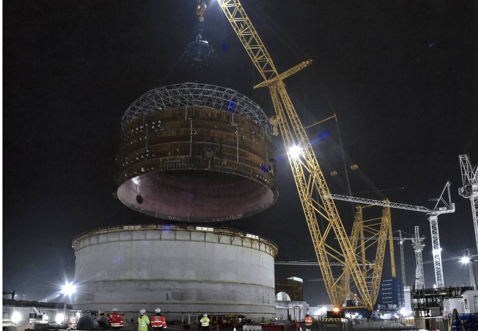
Die Erweiterung des Kernkraftwerks Hinkley Point im Südwesten Englands schreitet voran: Im November 2021 hob der riesige Kran «Big Carl» den ersten Teil des riesigen Stahlrings in das Gebäude des zweiten neuen Nuklearreaktors.

auch ökologischen Stromversorgung primär auf der Basis von modernen Kernkraftwerken durchgeführt werden muss. Auf der Zeitachse betrachtet, kommen für einen möglichen Aufbau eines neuen Nuklearkraftwerkparks vernünftigerweise nur Reaktoren der Generation IV in Frage. Sie haben verschiedene Vorteile: