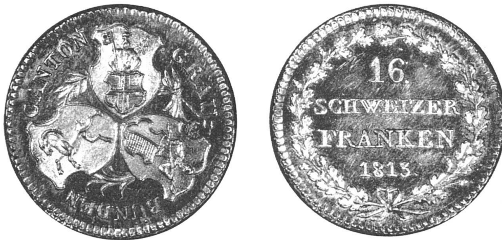
Fig. 3. Dublone zu 16 alten Schweizerfranken, 1813 geprägt aus Calandagold. Auf der Hauptseite die ins Kleeblatt gestellten Wappen der drei Bünde. Durchmesser 22 Millimeter. Gewicht 7,648 Gramm

Weitere Aufschlussarbeiten. Als die Aufschlüsse in der Grube zur „Goldenen Sonne“ den gehegten Erwartungen nicht entsprachen, begann man mit der Untersuchung der umgebenden Gebirgspartien.