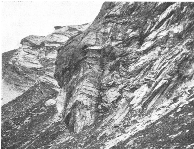
Fig. 1. Stark gefalteter Serpentin am Passo d'Ur bei Punkt 2551,3 m.

kleine Brocken von Serpentinegestein, berglederartige Fetzen und seltener etwas talkiges Material heraus. Die Qualität des an der Felsfront auf Klüften vorkommenden Asbestes konnten die Exkursionsteilnehmer selbst prüfen. Ausser den steilstehenden Klüften, die sog. längsfasrigen Asbest führen (siehe Seite 392), wären die weniger häufigen, zerrissartigen, bis meterlangen Klüfte wechselnder Orientierung, mit bis einige Zentimeter breiten „Cross-Fibre“ zu erwähnen. Bankungsartige Klüfte (Streichen N 145 \pm 5^{\circ} E , Fallen