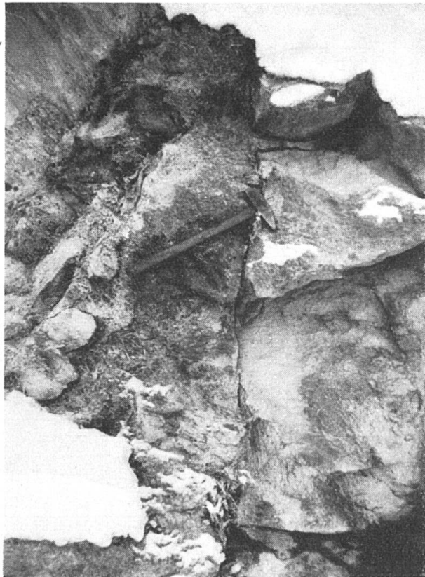
Fig. 3. Ansicht von asbestführenden Klüften. Faserbündel vom „Slip Fibre“-Typ sind unten (Bildmitte) deutlich erkennbar.

Querfasriger Chrysotilasbest, der in bezug auf Aussehen und übrige Eigenschaften der „Slip Fibre“ analog ist, wird weniger häufig gefunden. Auf das 19 Meter lange Profil (vgl. Fig. 2) entfällt nur eine Kluft mit querfasrigem Asbest. Die „Cross Fibre“-haltigen, wenige Zentimeter breiten Klüfte scheinen weniger