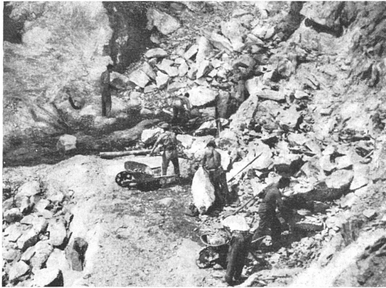
Fig. 5. Gewinnungsarbeiten in der Asbestgrube II.

tages im Bruch von Selva studiert werden konnte. Die angefertigten Dünnschliffe von Serpentinproben der Gegend Alpe Quadrada di Fuori und Piatte di Canciano zeigen fast ausnahmslos prachtvolle Beispiele der intensiven, bis ins Kleinste gehenden Fältelung. Die erstmalig aus dem Serpentinbruch von Selva durch F. DE QUERVAIN (8) bekannt gewordenen titanklinohumitführenden Gänge fand ich in guter Ausbildung auch an verschiedenen Punkten oberhalb der Asbestgrube. Während des Abbaues stiess man in der Grube wieder-