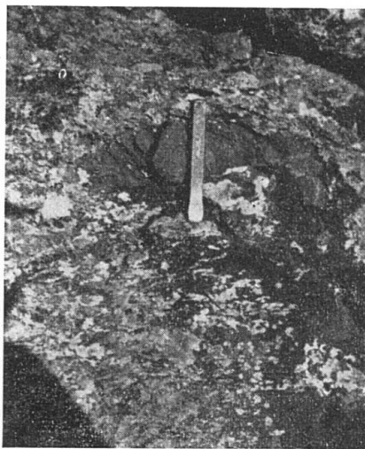
Fig. 1. Enclave calcaire dans la diabase du point 2001 (Flix). Le ciseau donne l'échelle

c) On remarque de nombreuses inclusions de toutes tailles et de toutes formes généralement intercalées entre les sphéroïdes. H. P. CORNELIUS s'est posé la question de l'origine de ces enclaves (1, p. 281), qui ne sont du reste pas toutes calcaires ainsi qu'il le croit (fig. 1).