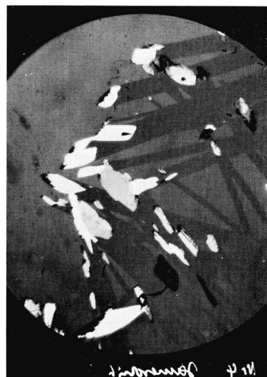
Fig. 3. Jamesonit in Quarz, Val da Claus. Erzanschliff, Vergrößerung 20\times .

Ähnliche Nadeln findet man manchmal als metallglänzende Einwachsungen in Quarzkristallen, die zumeist aus der Gegend südlich von Sedrun stammen. Im Val da Claus unterhalb Surrein am Eingang des Val Nalps fand 1961 der Strahler TUMAISCH CURSCHELLAS wiederum verschiedene derartige Quarze. Der grösste und schönste Kristall (Fig. 2) befindet sich im Naturhistorischen Museum in Bern, während kleinere Bruchstücke zur Untersuchung von uns erworben wurden.