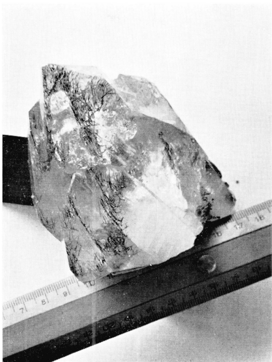
Fig. 2. Jamesonit in Quarz, Val da Claus (südlich von Sedrun). \frac{1}{2} natürliche Grösse.

Die Ausbildung der beiden Mineralien ist etwas unterschiedlich. Bei dem Vorkommen, das in der Literatur als Piz Muraun (südöstlich von Disentis) verzeichnet ist, treten locker verfilzte, sehr feinstrahlige Aggregate eines Erzminerals auf (Fig. 1). Röntgenographisch erweisen sich diese Nadeln als Boulangerit. Die untersuchte Stufe ist auch in PARKER (1954, Tafel 19 gegenüber S. 113) abgebildet und fälschlich als Antimonit beschrieben. Spektralanalytisch lassen sich Pb und Sb, jedoch kein Fe erkennen.