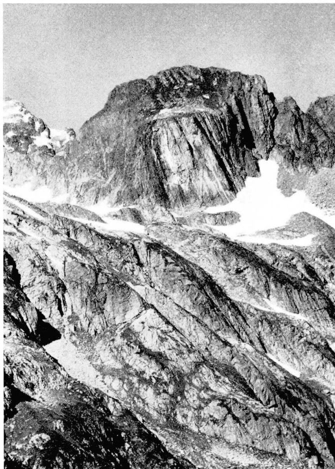
Fig. 1. Ein Beispiel für gut erhaltenen, voralpinen Baustil: grosse Kalksilikatfelslinse in der S-Wand des Guferstocks östlich der Sustenpasshöhe.

Kristallin aufgeschlossen. Grosse Areale dieses Kristallins weisen zudem einen alten Baustil auf, der vom alpinen räumlich völlig abweicht (Fig. 1). Daher lassen sich Interferenzen alter und junger Gefüge an vielen Stellen beobachten (Fig. 2).