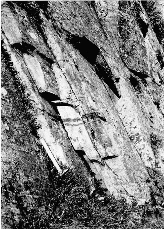
Fig. 2. Erste, alpine Schieferung durchsetzt die fast horizontale Bänderung eines Amphibolits. Lauchernalp, Lötschental.