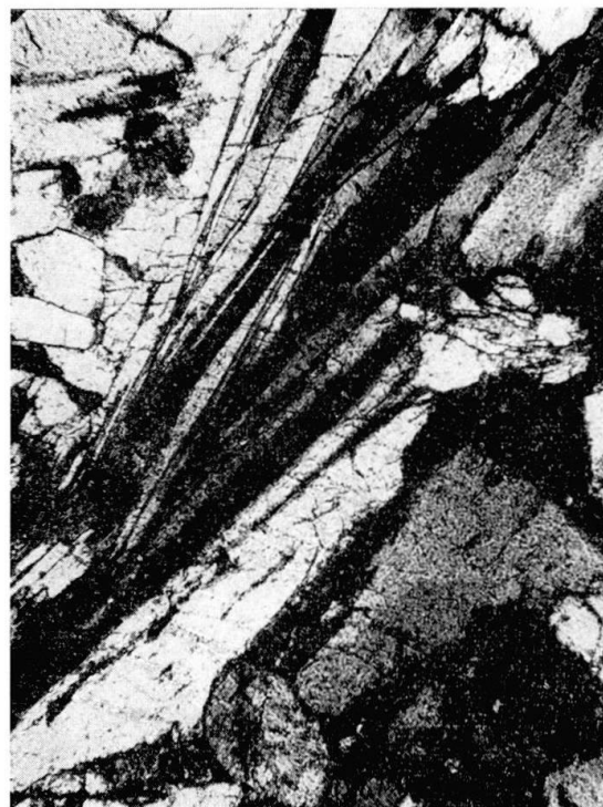
Fig. 4. Pyroxmangit (verzwillingt) - Rhodochrosit (unten rechts und oben links) - Fels. N. Chastelets, Bernina. Alle Abbildungen 80 ×