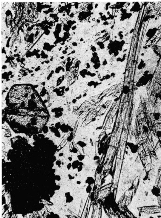
Fig. 3. Braunit (opak) - Spessartin (idiomorpher Kristall links) - Na-Amphibol (Prismen) Quarz-Albit (Matrix) - Fels. W Piz Corvatsch, S. Chastelets. Ohne Analysator.