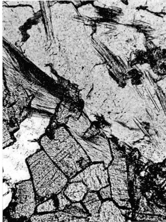
Fig. 2. Aegirinaugit-Spessartinfels, Furtschellas. In Klüften (links und oben) Albit (Matrix) Na-Amphibol (Prismen) und Parsettensit (dunkle Nadeln). Ohne Analysator.