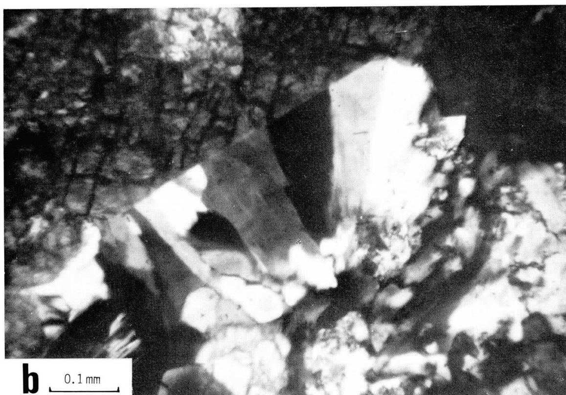
Planche I parthéite fibroradiée (a) et en grains subidiomorphes (b).