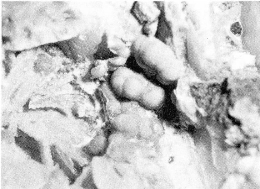
Abb. 1 Arsenocrandallit in nierenförmigen Krusten auf Schwerspat. Neubulach. Vergr. ca. 16,5 x.

Für die nachfolgende Beschreibung wurden zwei Mineralproben benutzt, die sich im Chemismus etwas stärker voneinander unterscheiden. Während die eine Probe, deren Fund dem verstorbenen Mineraliensammler C. SCHWINGHAMMER, Nonnenhorn, zu verdanken ist, in stärkerem Masse von der Idealformel abweicht, kommt die andere, die vom Verfasser 1958 gefunden wurde, dieser relativ nahe, sofern man vom schwankenden Strontiumgehalt absieht. Auf der erstgenannten Stufe bildet das neue Mineral mehr oder minder nierenförmig ausgebildete dünne Krusten auf Schwerspat (Abb. 1). Die Farbe der Krusten ist blaugrün. Andere Sekundärbildungen sind auf der Stufe nicht vertreten.