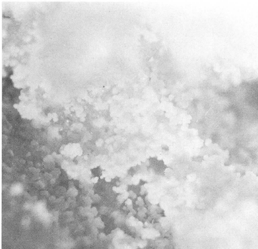
Abb. 3 Weilerit (sulfatfrei) in sphärolithischen Aggregaten. Grube Clara. Vergr. ca. 46 x.

gaten bestehende Krusten von weisser bis gelblich-weisser Farbe auf Schwer- spat (Abb. 3). Der Durchmesser der Sphärolithe erreicht knapp 0,05 mm.