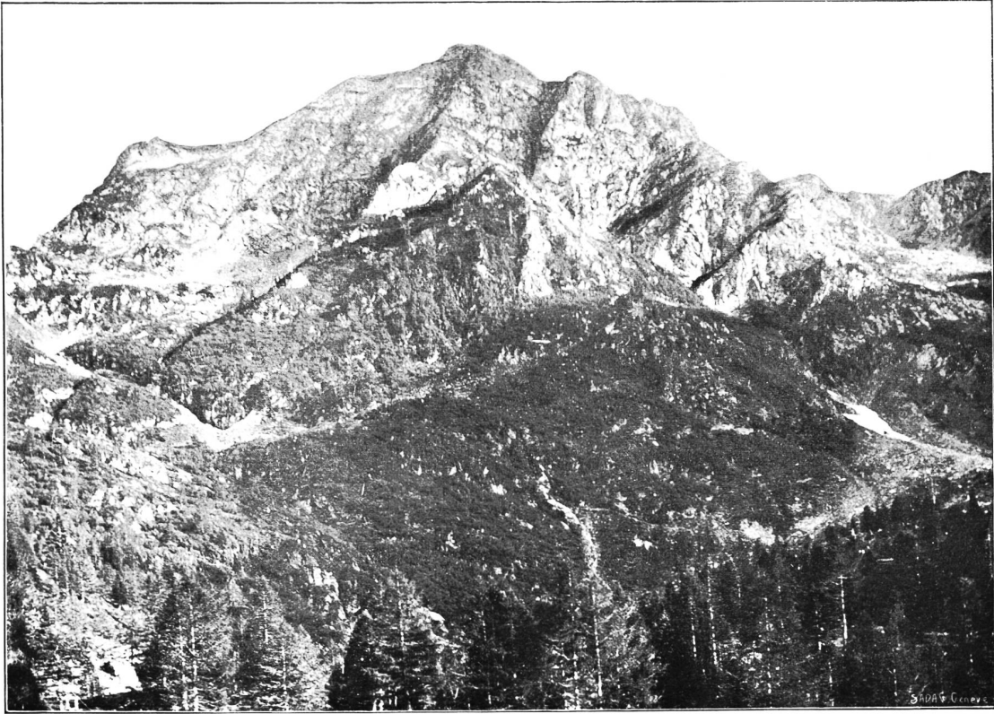
Tav. II. — Il corpo centrale del Camoghè (Vers. Nord) veduto dall'Alpe di Caneggio (1500 m.)