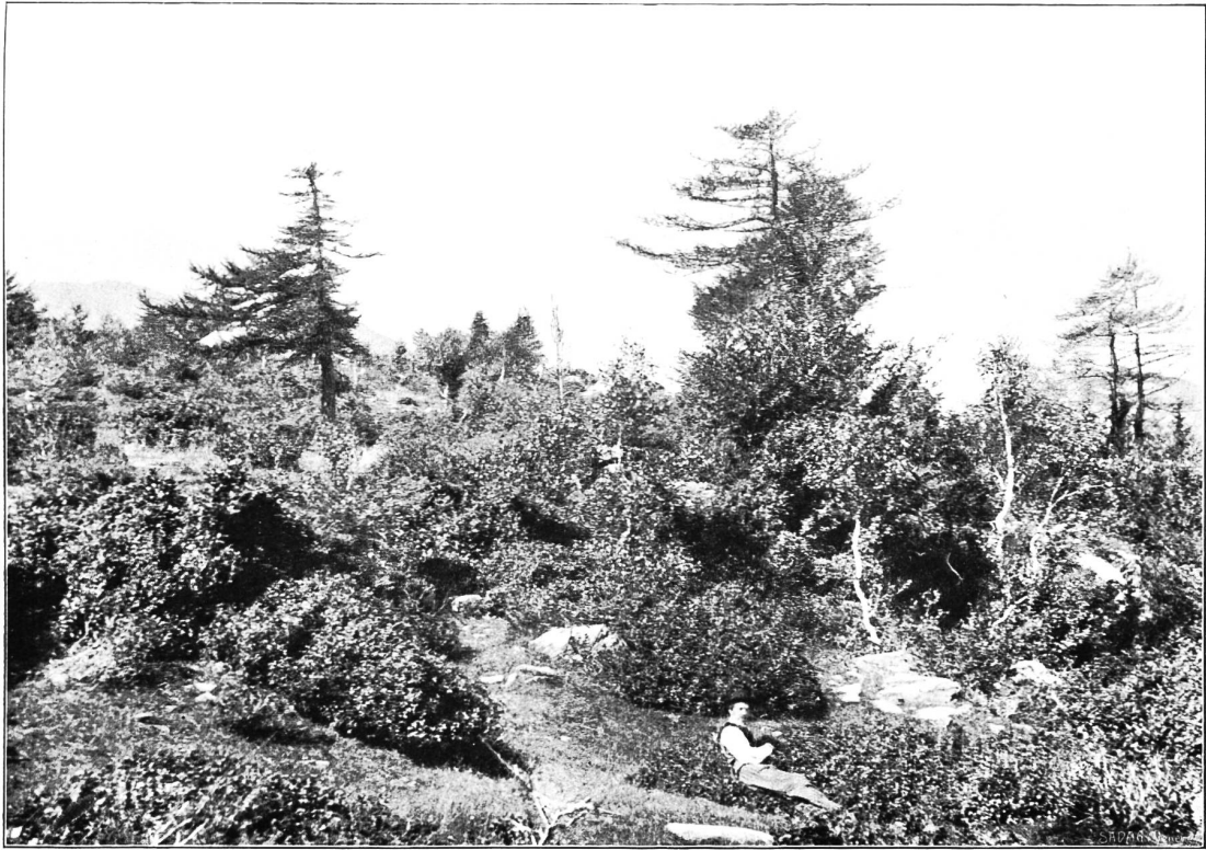
Tav. IV. — Tipo di pascolo boscato al Dosso della Torretta (1000 m.) in V. Isona.