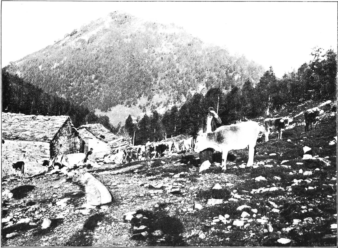
Tav. V. — Pascolo dell'Alpe di Caneggio (1500 m.) colla cima di Corgella (1740 m.)