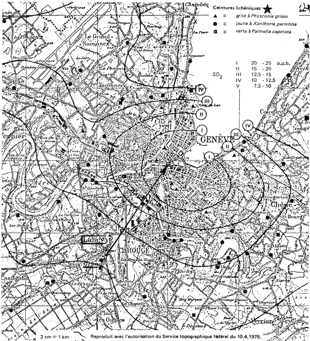
Fig. 1. - Carte de distribution de lichens indicateurs * localisés dans les auréoles du gradient de concentration croissante de SO 2 en direction du centre-ville. Les petits ronds noirs, nouvellement placés sur le transect Grand-Lancy - Place Bel-Air, localisent les colonies de Xanthoria parietina non décelées en 1974-75 et présumément néoformées depuis sur la rive droite de l'Arve avant sa jonction avec le Rhône.