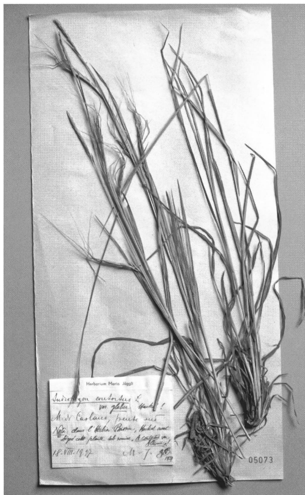
Fig. 3 – Campione di trebbia contorta ( Heteropogon contortus ) raccolto al Monte di Caslano (erbario Mario Jäggli).

mata principalmente di rocce calcaree e dolomitiche. I dati, pubblicati nell'« Archivio Botanico », informano della presenza di 140 specie, 7 delle quali mediterranee, 10 dell'elemento « europeo-meridionale », 24 atlantiche, 77 dell'elemento « mesotermico boreale » e 22 cosmopolite. Il confronto è interessante. « Nella florula dei due colli [...] le specie mediterranee, europee-meridionali ed atlantiche sono rappresentate pressoché in egual numero (in ogni caso da identica percentuale) e cioè 41 al Monte di Caslano, 44 al colle di Sasso Corbàro » (JÄGGLI 1930). Ma se sul Monte Caslano le briofite mediterranee sono distribuite su tutti i versanti, segno che il clima generale fruisce appieno dell'effetto mitigante del lago, sul colle di Sasso Corbàro la florula mediterranea caratterizza solo il versante a meridione: « ivi unicamente hanno sede i rappresentanti mediterranei ».