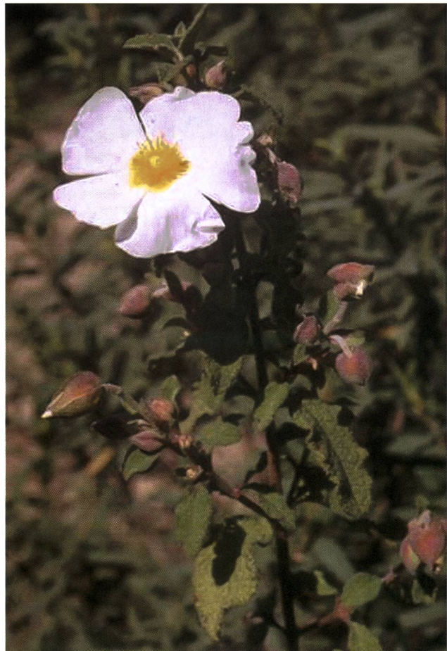
Fig. 2 – Cisto femmina ( Cistus salvifolius ).