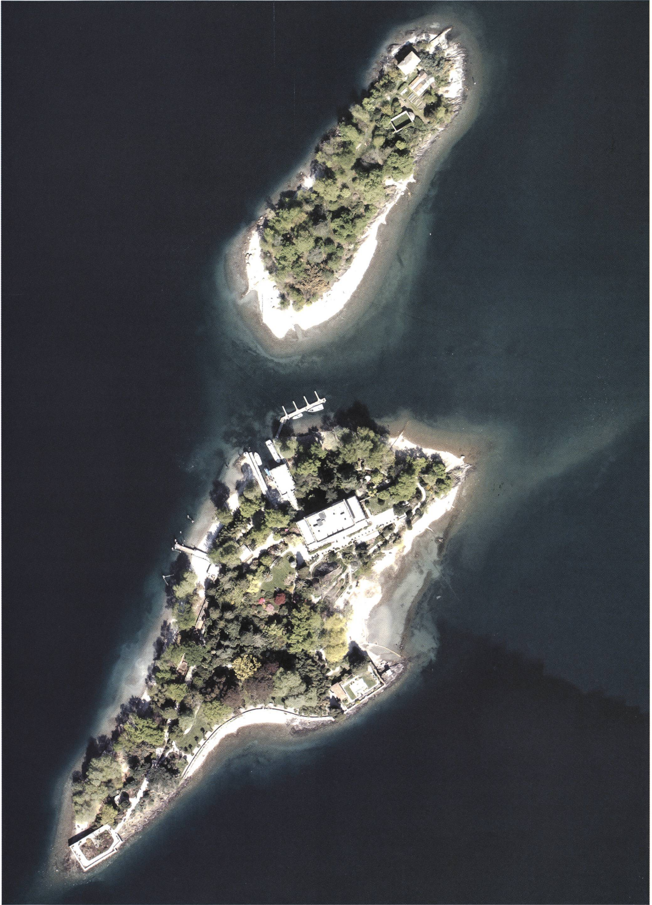
Fig. 4 – Le Isole di Brissago, ortofoto digitale, volo aprile 2002.