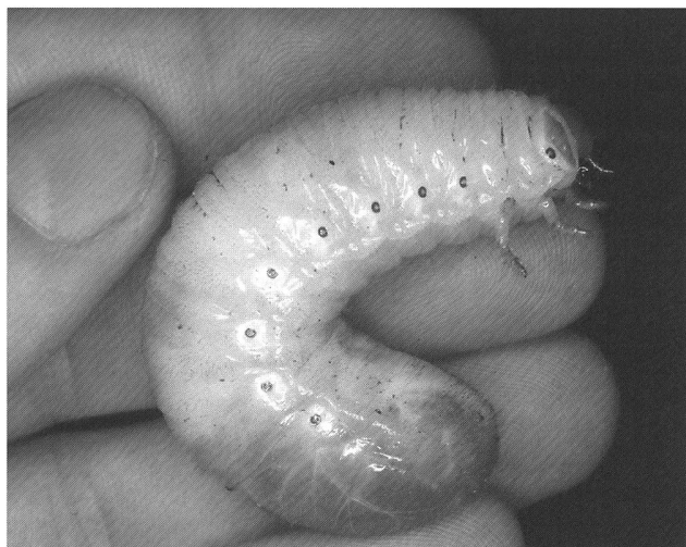
Fig. 2 - Larva matura di Osmoderma eremita .

Larva esapode, di tipo melolontoide, corpo bianco incurvato a «C» con testa bruna, inserita verticalmente sul resto del corpo, fortemente sclerificata (fig. 2). Al massimo sviluppo le gigantesche larve di questa specie raggiungono i 6 cm di lunghezza per un peso che si aggira attorno ai 12-13 grammi e oltre.