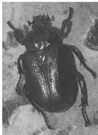
Fig. 1 - Esemplare di Osmoderma eremita .

Peloponneso. Tutto il Genere raggruppa un piccolo numero di specie infeudate soprattutto alle grandi foreste di latifoglie. In questi ultimi anni sono state descritte nuove entità appartenenti al Genere Osmoderma , due delle quali presenti nell'Italia centrale e meridionale, il cui status tassonomico esula comunque dai fini di questa trattazione eminentemente tecnica.