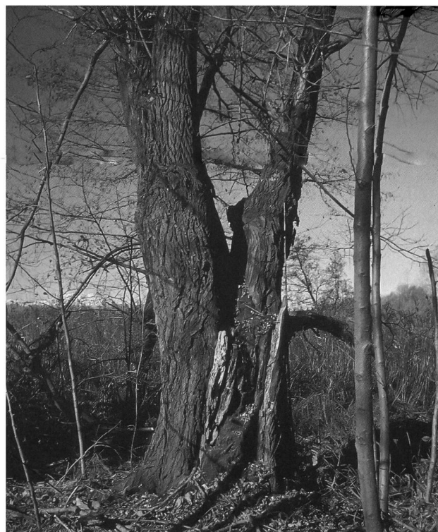
Fig. 5 - Vetusto esemplare di Salix alba , in cui risulta evidente il cedimento di una branca del capitozzo, e conseguente perdita della funzionalità del cavo centrale.

legname asportato veniva utilizzato per paleria (pali tutori per viti etc.) o più frequentemente come legname da ardere in quello che si potrebbe definire coloritamente «un ceduo sospeso». Dopo la seconda guerra mondiale, con lo sviluppo economico e l'abbandono della campagna, queste pratiche finirono con l'essere abbandonate, e la dimensione delle branche gravanti sul capitozzo andò continuamente aumentando sino a raggiungere dimensioni tali per cui la pianta, sottoposta al peso dei rami, si schianta o si fende, giungendo molto spesso ad aprire il cavo che va così perso, almeno per gli scopi di questo studio (fig. 5). Va inoltre ricordato come queste piante cave abbiano anche un notevolissimo valore naturalistico verso un gran numero di vertebrati superiori, come l'alocco, il torcicollo, il ghiro, il moscardino, alcune specie di Picidi e non ultimo anche varie specie di Chiroteri.