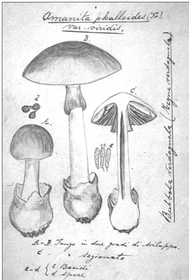
Fig. 3 - Amanita phalloides . Tavola di C. Benzoni

1983: Eleno Zenone: Elenco delle Polyporaceae s.lato presenti al Museo cantonale di Storia naturale in Lugano fino al 31 dicembre 1983 (ZENONE 1983).