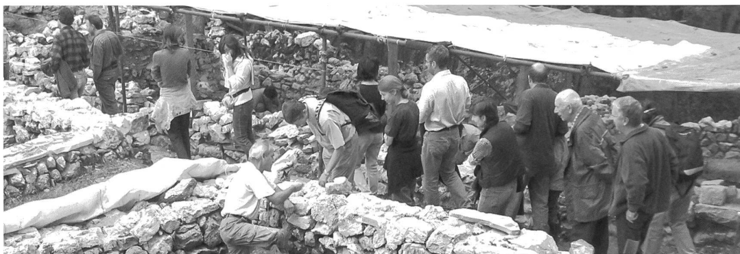
«Visita agli scavi archeologici di Tremona», escursione del 2 ottobre 2004.