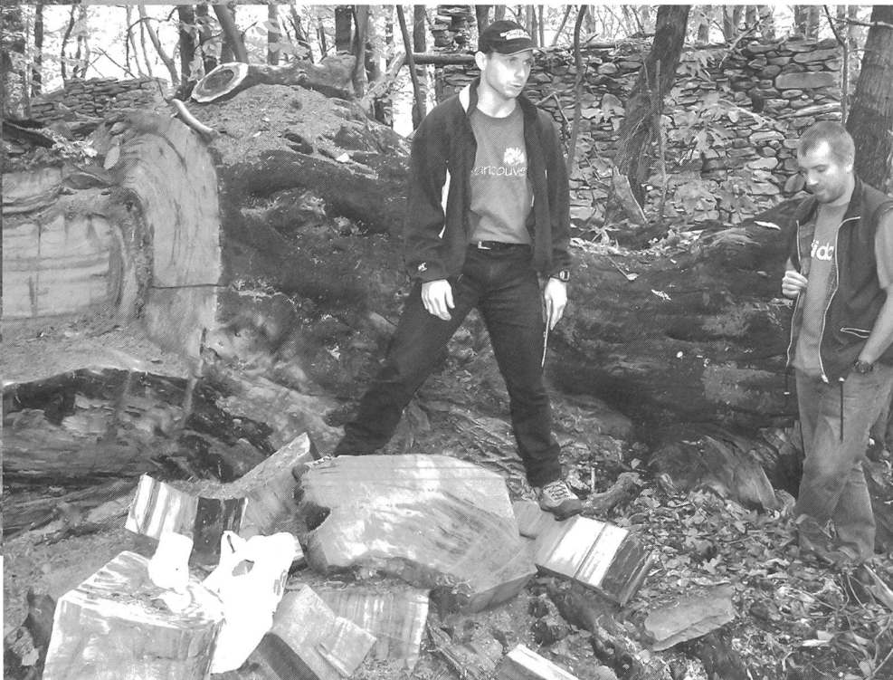
«I castagni monumentali», escursione del 9 ottobre 2004,