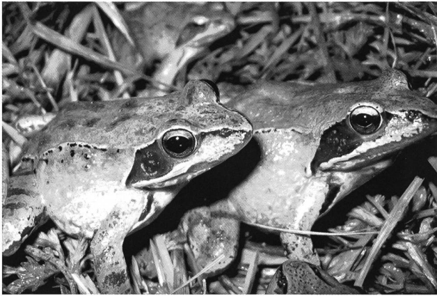
Fig. 5 – Esemplari di Rana dalmatina .