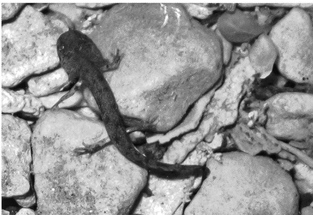
Fig. 6 – Larva di salamandra pezzata.

che è la popolazione più numerosa di questa specie in tutto il Monte di Brianza (MANENTI 2004). Inoltre le informazioni raccolte nel corso di questo censimento si prestano anche alla predisposizione di percorsi didattici ed escursionistici, non invasivi, che possano permettere di far apprezzare e conoscere il valore naturalistico degli ambienti umidi presenti nell'area d'indagine e favorire così la sensibilizzazione dell'opinione pubblica verso l'importanza della loro salvaguardia.