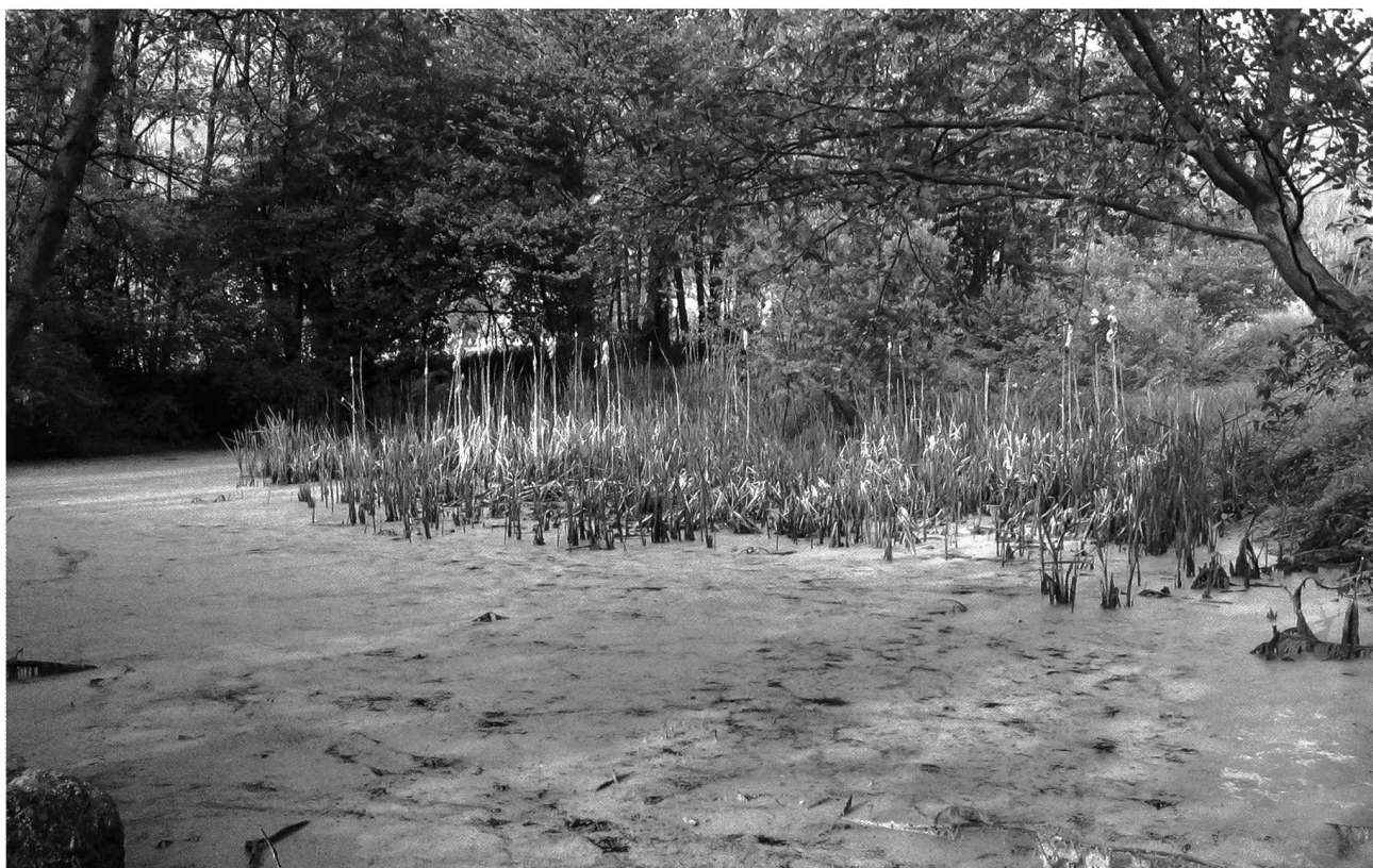
Fig. 4 – Stagno a Castello Brianza nella Piana di Prestabbio dove si riproducono 6 specie di anfibi.