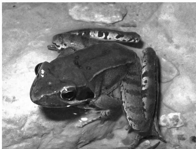
Fig. 3 – Maschio di rana di Lataste.

anni di ricerca siano poi in anni successivi scomparsi. Tra questi si ricordano in particolare un'antica vasca artificiale, poi completamente riempita con le macerie di un vicino cantiere, che era situata a Cavonio in comune di Dolzago dove si riproducevano B. bufo , P. synkl. esculentus , R. temporaria , R. dalmatina e nei pressi della quale erano stati osservati anche individui di S. s. salamandra , e R. latastei e un lavatoio a Castello Brianza in località Roncaccio, dove abbondantissime erano le larve di S. s. salamandra , che è stato distrutto da una frana. L'aspetto più preoccupante è il grave stato d'interramento nel quale versano quasi tutti i biotopi lentici naturali censiti; da considerare a questo proposito che dal 1996 a oggi almeno il 70% di essi ha visto ridursi la propria superficie di oltre il 50%. A rischio anche il bello stagno già ricordato dove si riproducono ben 6 specie di Anfibi diverse. Particolarmente grave anche la situazione di due piccoli invasi naturali