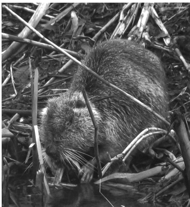
Fig. 4 - Esemplare di Nutria ( Myocastor coypus ).