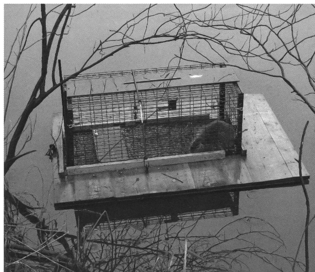
Fig. 1 – Trappola galleggiante utilizzata per la cattura delle Nutrie.

Il rilevamento di indici di presenza della Nutria (in particolare sterco, impronte, tane, scivoli e sentieri) è una tecnica efficace per fornire indicazioni sulla presenza e sulla densità della specie. Tale rilevamento è generalmente semplice, poiché le tracce lasciate dall'animale sono di norma inconfondibili (PRIGIONI et. al. , 2003). Sono pertanto state effettuate uscite mirate sul terreno percorrendo i principali canali delle Bolle di Magadino