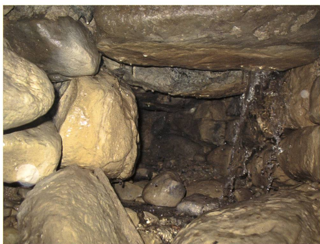
Fig. 3 – La galleria protostorica della Mojenca nei pressi di Como.

Per il rinvenimento delle gallerie drenanti e delle altre sorgenti è stata di fondamentale ausilio la consultazione della bibliografia locale e degli studi già condotti nell'area, soprattutto per quanto riguarda l'area del Monte Barro (NARDO & GUGLIELMIN 1996, PEZZOLI 2007), del Monte di Brianza (PEZZOLI 2007, MANENTI 2008) e del Parco Regionale Spina Verde di Como (GASPANI 2000). Nelle restanti zone si è proceduto tramite inchieste presso associazioni e abitanti locali e tramite l'esplorazione diretta del territorio. I rilievi sono stati condotti a partire dal mese di settembre del 2007 sino al mese di settembre del 2009. Per ogni sorgente indagata sono state rilevate le dimensioni della galleria o della struttura sotterranea