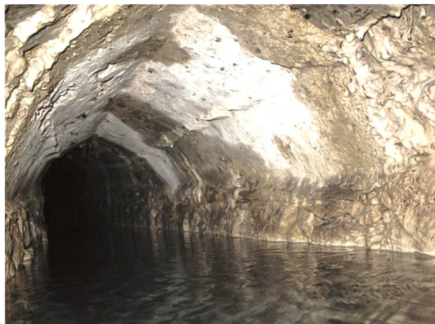
Figg. 4 e 5 – Ingresso ed interno della galleria g9 in località Posca.

Una particolare problematica di conservazione è relativa a S. salamandra e legata alla struttura delle raccolte d'acqua. Infatti nella sorgente g2, g10, b2 e b6 è stata riscontrata una notevole difficoltà nella fuoriuscita sia dei neometamorfosati, sia delle femmine che vi si sono recate per deporle. In particolare nelle vasche della sorgente g2 sono state rinvenute femmine intrappolate in evidente stato di inedia; numerosi casi di annegamento sono stati osservati nelle profonde vasche della sorgente b2.