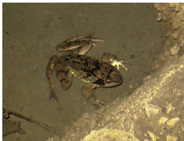
Fig. 6 – Esemplare maschio di R. temporaria trovato all'ingresso della sorgente g9.

In generale è comunque possibile affermare come le sorgenti analizzate mostrino sia dal punto di vista delle caratteristiche fisiche ed ambientali, sia del popolamento biologico che le caratterizza, numerose analogie e diverse peculiarità. Dal punto di vista della biodiversità ulteriori indagini devono essere condotte a proposito del popolamento acquatico. È comunque interessante la coesistenza di organismi troglotili e tipici della fauna endogena, l'osservazione di taxa tipicamente stigobi e stigofili e la funzione di rifugio e di sito riproduttivo che questi ambienti possono svolgere per alcuni Anfibi. Un ruolo determinante sembra essere giocato dall'accessibilità. Le sorgenti più vecchie ed inutilizzate da parte dell'uomo sono quelle in cui l'accessibilità è favorita a causa dal fatto che le porte che le chiudevano risultano divelte o mancanti. Qui si riscontra ovviamente il maggior nume-