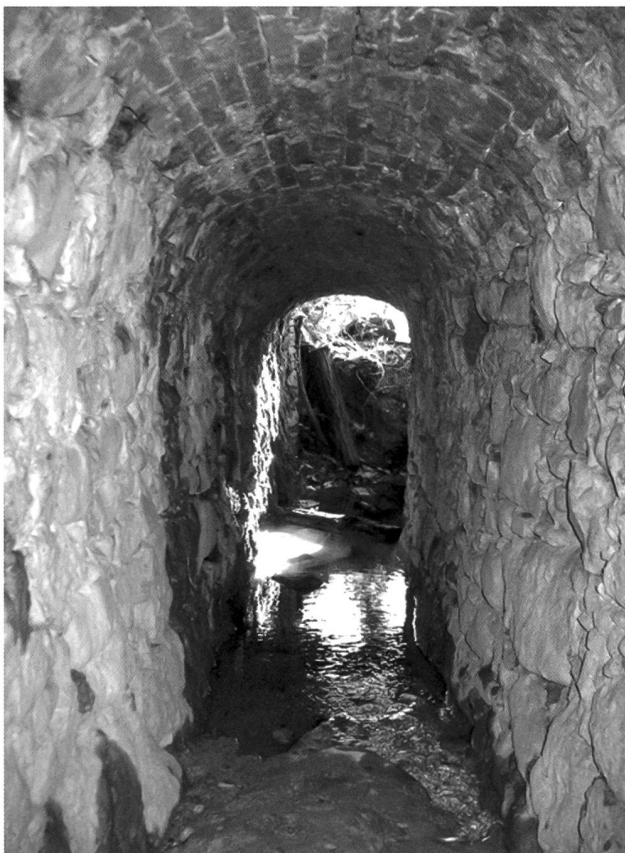
Fig. 1 – Galleria drenante g1 a Castello di Brianza (LC) (foto B. Bianchi).

L'area di studio è costituita da una discreta porzione di territorio compreso tra la provincia di Como, quella di Lecco e la porzione settentrionale della neocostituita provincia di Monza e Brianza. Tale zona d'indagine ricade in una porzione di quella che viene considerata la regione insubrica italiana (DIONIGI 2000) (fig. 2). Situata all'interno dei bacini imbriferi del Lambro, per la maggior parte, e dell'Adda e del Seveso in minor parte, l'area è caratterizzata dalla presenza di rilievi collinari e montuosi in cui è presente ancora una discreta percentuale di ambienti boschivi e di ampie aree pedemontane in cui l'urbanizzazione e la pressione antropica presentano spesso un notevole impatto. Tra le zone di interesse naturalistico situate