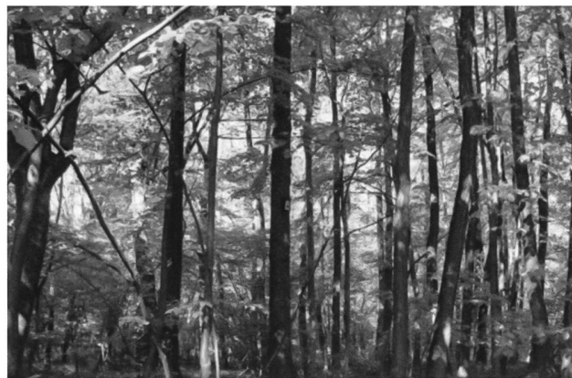
Stazione 2 - Bosco misto denso