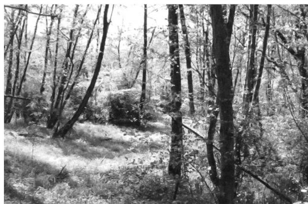
Stazione 6 - Ontaneto