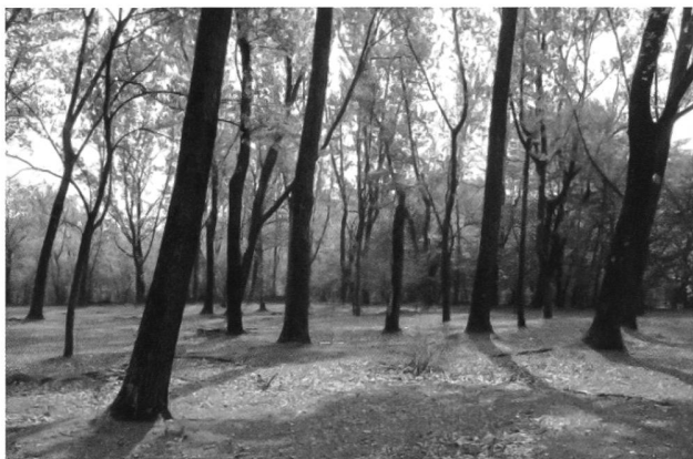
Stazione 1 - Pioppeto pascolato