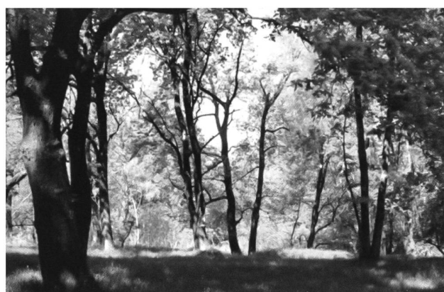
Stazione 4 - Querceto pascolato