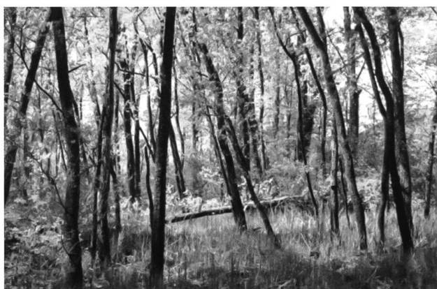
Stazione 5 - Saliceto bianco