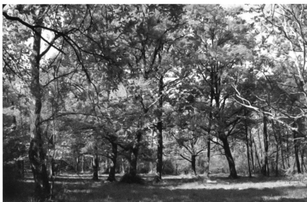
Stazione 3 - Querceto