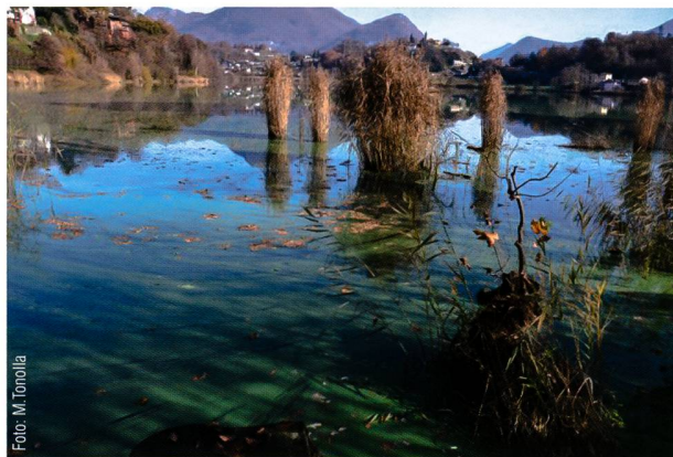
Fig. 1 - Fioritura algale nel Laghetto di Muzzano (novembre 2011).

Nel corso del mese di ottobre 2011, nel Laghetto di Muzzano si è verificata una fioritura che ha colorato le sue acque di una tonalità verde intenso (fig. 1). Sono stati effettuati due prelievi d'acqua di superficie il 10 ottobre e il 14 ottobre 2011, sulle rive in zona "Casa del Pescatore", dove il fenomeno era particolarmente evidente. In laboratorio, il campione è stato predisposto per la lettura. La metodologia di preparazione seguita per l'osservazione al microscopio degli organismi algali è quella di UTERMÖHL (1958), nota anche come "metodo del microscopio rovesciato" o "metodo di sedimentazione", attualmente l'unica per cui esiste un protocollo completo ufficiale europeo (UNI EN 15204). Il riconoscimento tassonomico ha previsto la sedimentazione delle cellule algali e l'uso di un microscopio ottico invertito (Zeiss Axiovert 10), effettuando le osservazioni con obiettivo a 400 ingrandimenti, basandosi sui testi di ANAGNOSTIDIS & KOMÁREK (1988, 2005). L'acqua di superficie è stata centrifugata e il pellet analizzato tramite MALDI-TOF (modalità Reflectron con matrice CHCA; TONOLLA et al. 2009), ELISA (QuantiPlate Kit for Microcystins, Envirologix USA) e HPLC.