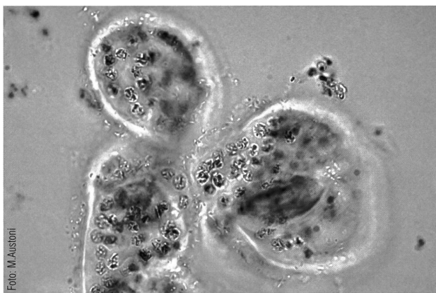
Fig. 2a - Microcystis wesenbergii (ingrandimento 40×).

I responsabili della fioritura sono stati identificati come cianobatteri delle specie Microcystis wesenbergii (fig. 2a) e Microcystis aeruginosa (fig. 2b).