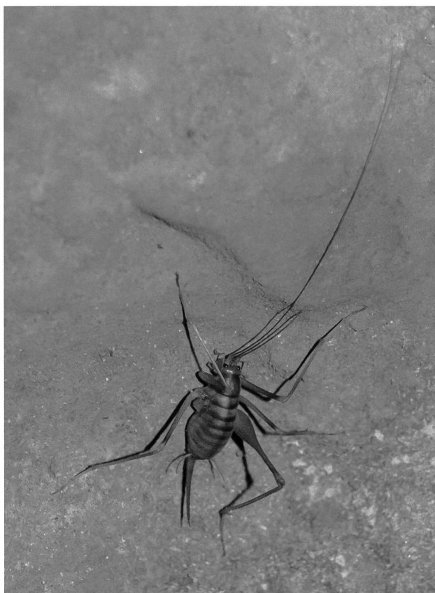
Figura 2: Habitus femmina.

Le Dolichopoda sono insetti atteri, con il corpo convesso dorsalmente, gli arti piuttosto sviluppati da cui deriva il nome e le antenne lunghe una volta e mezzo il corpo. Il colore del tegumento va dal giallo-bruno al rossiccio con bande trasversali più scure sui margini posteriori dei segmenti dorsali (fig. 2). Esse differiscono da Troglophilus per quanto riguarda la spinulazione delle tibie posteriori e la forma dell'apparato genitale maschile. Quest'ultimo, nelle Dolichopoda presenta un epifallo (fig. 3) ben sviluppato e piuttosto sclerificato a forma di Y con il ramo impari curvo e appuntito all'apice. La determinazione delle specie avviene attraverso l'analisi delle caratteristiche specifiche dell'organo riproduttore maschile (Baccetti, 1966; Baccetti & Capra, 1959, 1970; Harz, 1969; Rampini & Di Russo, 2003; Di Russo & Rampini, 2012).