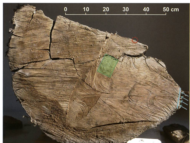
Figura 5: Sezione parziale del tronco prima della lisciviazione (26 luglio 2013). Il cerchio rosso indica la posizione del centro (midollo). Il rettangolo verde evidenzia la porzione di legno impiegata per la datazione al radiocarbonio. Le frecce azzurre mostrano l'unica zona che ha subito un'importante abrasione superficiale. Qui il solco risultante ha una profondità massima di 6 cm corrispondenti a 38 anelli mancanti.