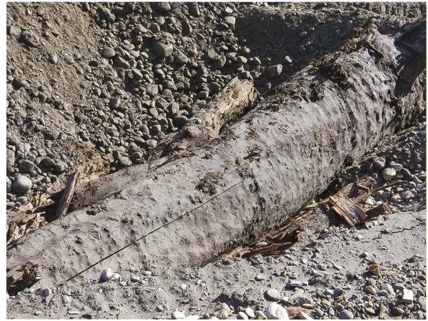
Figura 3: Il tronco subfossile come si presentava appena estratto e spostato dall'escavatore (26 febbraio 2013). I sedimenti sono del tutto simili a quelli del deposito originale.