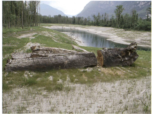
Figura 4: Il tronco subfossile provvisoriamente deposto accanto al laghetto artificiale (27 giugno 2013). Si noti l'ingrossamento basale del fusto e il taglio effettuato con la motosega per ricavare la rotella analizzata.