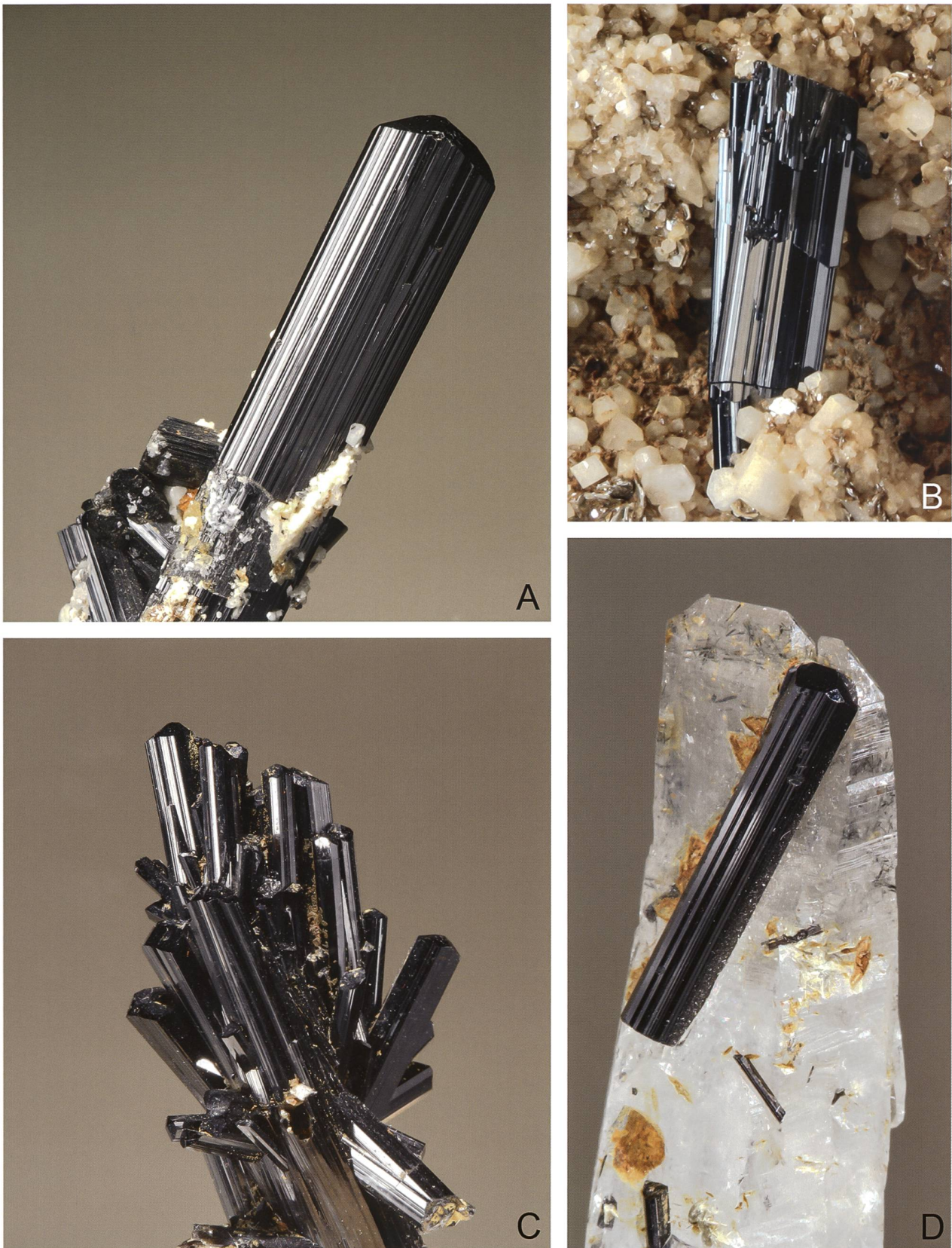
Figura 3: Cristalli di tormalina nera della regione San Gottardo-Piora. A) Uno dei più begli esemplari rinvenuti in Ticino, cristallo di 4 centimetri scoperto da Don Franco Buffoli a Madrano, Museo cantonale di storia naturale, #3491. B) Tormalina nera proveniente dagli Ovi di Scimfuss (San Gottardo), cristallo di 1 centimetro scoperto da Carlo Peterposten. Museo cantonale di storia naturale, #10809. C) Gruppo di 2.5 centimetri di altezza, Madrano, Collezione Carlo Peterposten. D) Tormalina nera su quarzo, Pöncioni Negri, poco distanti dal Pizzo Taneda. Il cristallo più grande è lungo 2 cm, Collezione Carlo Peterposten.