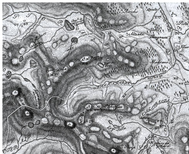
Figura 2: Dettaglio estratto dalla Carte pétrographique du S. t Gothard di Exchaquet et al. del 1791 (in de Méchel 1795) con Airolo, Ritóm e San Gottardo (il nord è a sinistra); al centro sinistra il Pizzo Taneda con le sigle T m Tourmaline , SN Schorl noir e FC Feldspath cristallisé , possibilmente adularia, scoperta nel 1781 da Ermenegildo Pini; alla Cappella di San Carlo S s Sapare ou Ziannite , la cianite o distene.