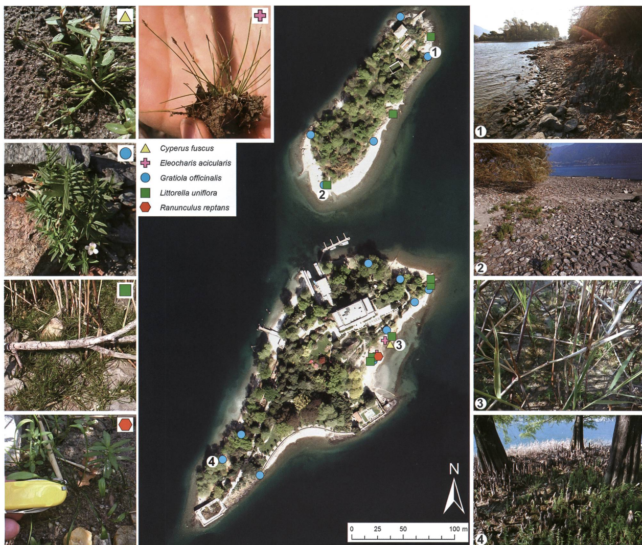
Figura 1: Distribuzione delle specie caratteristiche della zona ripuale e iscritte nella Lista rossa rilevate alle Isole di Brissago. Rilievo floristico selettivo di specie spontanee effettuato il 7 ottobre 2016, con il livello del Lago Maggiore a quota 192.36 m s.l.m. (dati della stazione di misurazione di Locarno (nr. 2022; UFAM, 2016). Sono numerate le rive illustrate di fianco. Categoria di minaccia IUCN secondo Bornand et al. (2016): VU: Cyperus fuscus , Eleocharis acicularis e Gratiola officinalis ; EN: Littorella uniflora e Ranunculus reptans . Immagine satellitare delle Isole di Brissago.

2.43 m di differenza dal massimo annuale raggiunto in giugno (stazione di misurazione Lago Maggiore – Locarno; UFAM, 2016). Il livello particolarmente basso dell'acqua ha esposto per un mese e mezzo un'ampia superficie di riva, permettendo alla vegetazione ripuale spontanea, ben adattata a questo ambiente, di affiorare in maniera rigogliosa. Le rive sono uno degli ambienti naturali maggiormente minacciati in Svizzera, in particolare dall'edificazione, dall'eutrofizzazione delle acque, dalla regolazione artificiale dei livelli dell'acqua e dalle attività di svago (calpestio), e ospitano numerose specie rare e minacciate, con ben il 65% delle specie caratteristiche di questo ambiente naturale iscritte nella Lista rossa delle Piante vascolari (Delarze et al., 2015; Bornand et al., 2016).