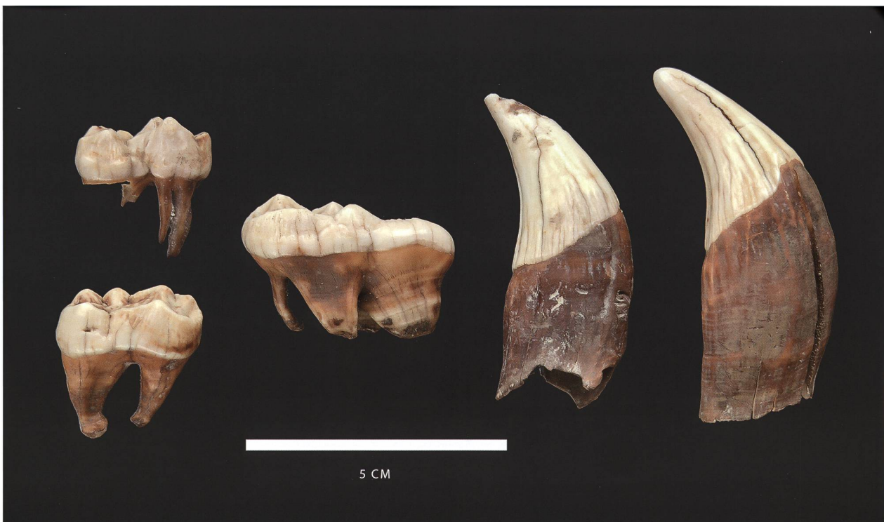
Figure 2: Dents d'ours brun ( Ursus arctos ) du Pléistocène supérieur (Grotta Bas, Rovio).

Ils étaient accompagnés d'un tibia gauche de chamois ( Rupicapra rupicapra ), de divers ossements de lièvre ( Lepus cf. europaeus ), d'os du squelette d'une martre ou fouine ( Martes sp.), d'animaux domestiques ( Bos taurus , Felis catus ) et autres ongulés indéterminés ( Capra/Ovis sp.). Divers oiseaux complètent cette liste ( Corvus corone , Turdinae sp., Aves sp.). Bien que non datés, tous ces autres ossements semblent plutôt récents, donc non contemporains de l'ours. Le remplissage de cette cavité est par endroits constitué de pierres, par endroits de sédiment plus fin.