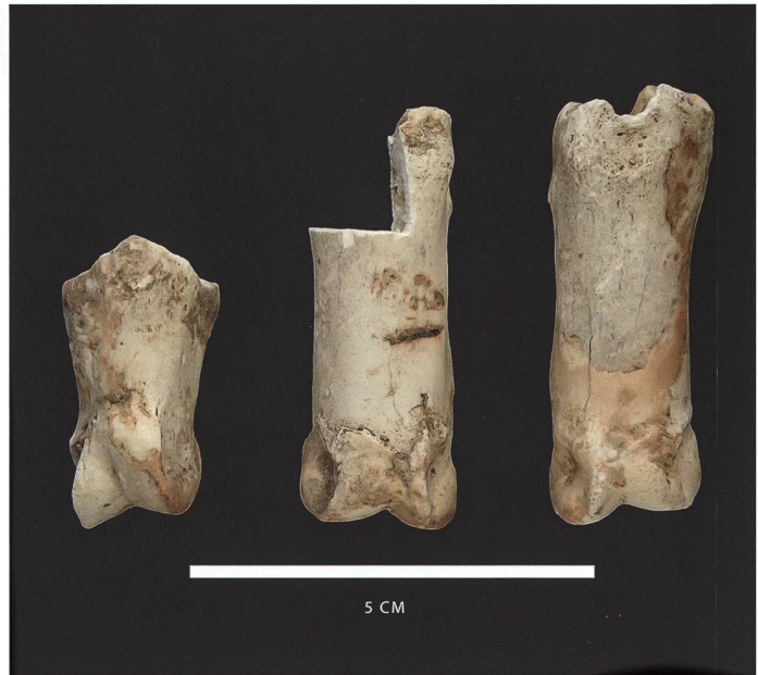
Figure 1: Phalanges de bouquetin ( Capra ibex ) du Pléistocène supérieur (Grotta Gerosa, Castel San Pietro) (foto: Rémy Wenger).

La grotte G3 (Echantillon SpéléOs n° 148-14) a livré des ossements d'ours brun ( Ursus arctos ), un humérus gauche (fig. 4) et un tibia gauche. La datation de l'humérus a livré un âge calibré de 47457-43657 BC ( 43920 \pm 903 14C BP, ETH-64938, tab. 2). La mesure du diamètre transverse minimum de la diaphyse (DTmD) a donné la dimension de 31.0 mm, confirmant l'appartenance plus probable à U. arctos (22.4-43.0 mm) plutôt que U. spelaeus (35.8-55.5 mm) selon les dimensions