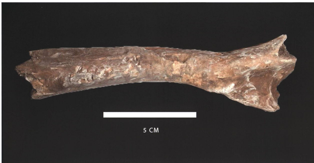
Figure 3: Humérus d'ours brun ( Ursus arctos ) juvénile (Grotta Bas, Rovio).