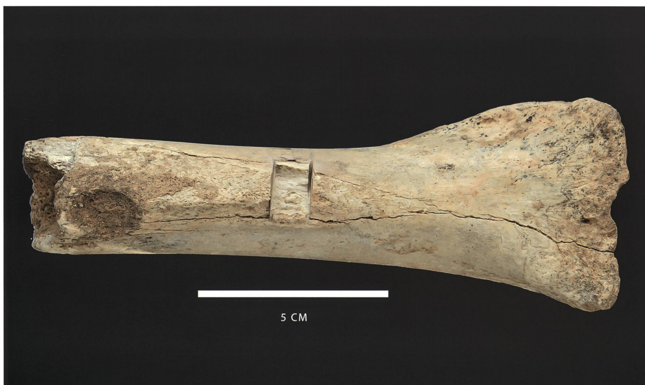
Figure 4: Humérus d'ours brun ( Ursus arctos ) du Pléistocène supérieur (Grotta G3, Capolago).

La datation d'un fragment d'humérus d'ours brun