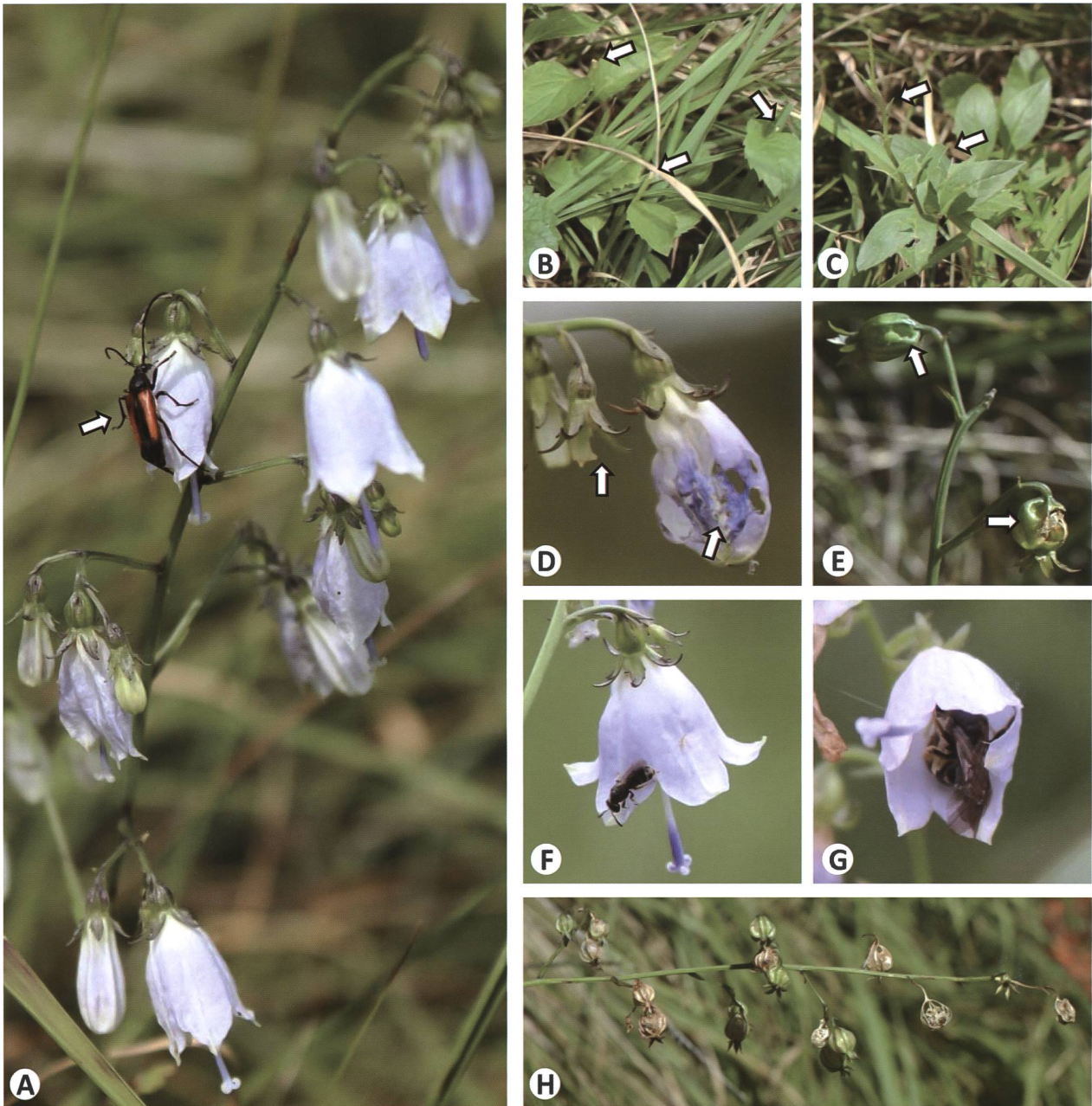
Figura 3: Ecologia delle interazioni nella popolazione di Adenophora liliifolia sul Monte San Giorgio (Ticino, Svizzera). A , Uno dei pochi individui con un'infiorescenza composta, visitata da un coleottero florivoro, Purpuricenus kaehleri (Linnaeus, 1758; freccia). B , Individui completamente mangiati (freccia) da mammiferi erbivori. C , individui con foglie consumate da insetti erbivori (freccie). D , fiori e E , frutti con danni dovuti alla consumazione da florivori e alle ferite da parte di insetti succhiatori. F-G , esempi di api solitarie quali potenziali impollinatori: F , Andrena sp., e G , Ceratina sp. H , una delle poche infruttescenze rilevate con frutti verdi immaturi e frutti maturi di color marrone.

specie prativa dominante, Molinia arundinacea , che sviluppa cespi ampi e una vegetazione molto densa, sembrava soffocare A. liliifolia , coprendo completamente gli individui più piccoli e parzialmente quelli più grandi. In totale, 44 individui (37.3%) dell'intera popolazione presentavano danni riconducibili ad almeno uno dei tipi di erbivoria osservata. Da notare che la consumazione delle foglie è stata rilevata solamente in luglio; pertanto, mancano dati relativi agli individui trovati in agosto.