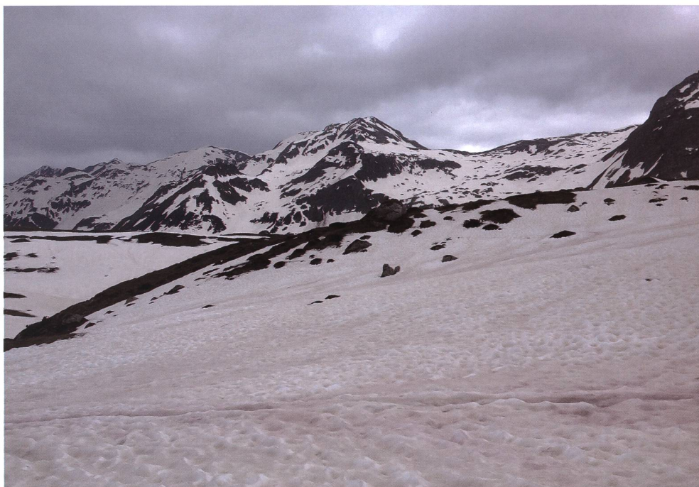
Figura 2: Piano dei Canali - Passo del Lucomagno (Cantone Ticino), giugno 2014, una delle due località svizzere di rinvenimento di Neagolius schlumbergeri consobrinus (Daniel, 1900) (foto: E. Bariffi).